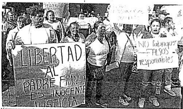
Feligreses cercanos al sacerdote detenido bloquearon ayer Avenida Insurgentes Sur para pedir su liberación.