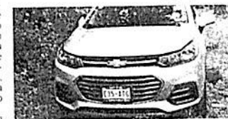
El cuerpo de Leonardo fue hallado dentro de su propio auto

04:01 HORAS Se va del lugar el segundo vehículo, con dirección a la carretera Picacho-Ajusco