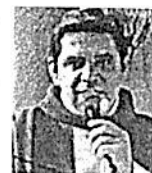
El párroco es quien pidió por los feligreses.

"Daba todo por su comunidad, es el exorcista, sin miedo a la verdad, sin miedo al demonio, sin miedo a cualquier caso que le llegara", indicó una de las fieles en redes sociales.