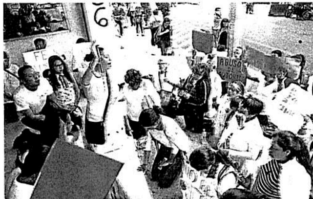
En la entrada de la PGJ, un grupo rezó un rosario

"La Iglesia católica espera y confía en el trabajo de las autoridades"