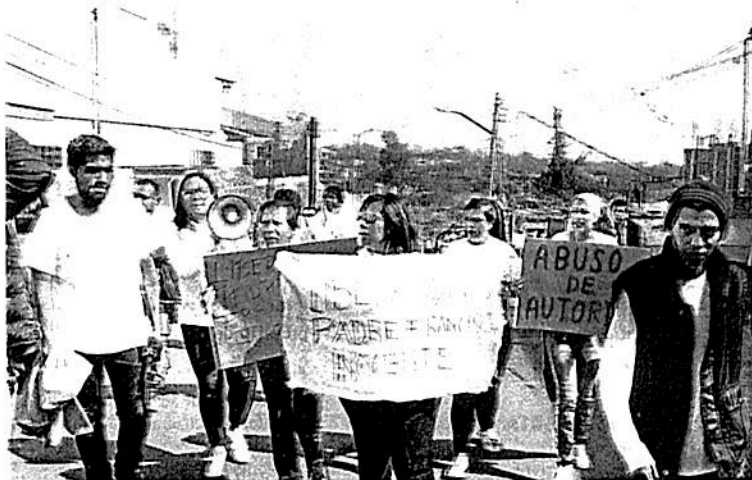
La comunidad de la iglesia Cristo Salvador exigió la liberación del cura

Como no se aceptaron preguntas y respuestas, los funcionarios dejaron cabos sueltos, por ejemplo, el móvil del asesinato, y si el segundo carro que llegó a la escena del crimen era tripulado por más de una persona.