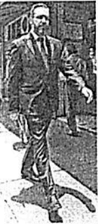
El secretario de Seguridad, camino al Congreso