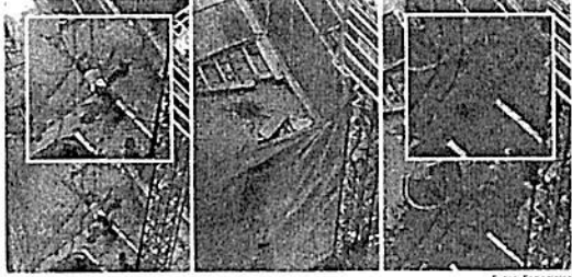
mismos obreros lavando con agua y escobas.

De acuerdo con una serie de fotos y videos que hicieron llegar a este diario, se observó el cuerpo en el piso, luego como presuntos trabajadores cubren con una lona el punto donde cayó el hombre y, más tarde, ya sin el cuerpo, los mismos obreros lavando con agua y escobas.