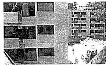
Por las ventanas de 30 departamentos, REM Reingeniería Ecológica S.A. de CV, cobró más de cuatro millones de pesos