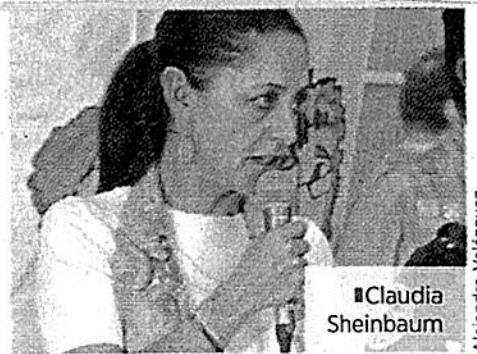
■ Claudia Sheinbaum