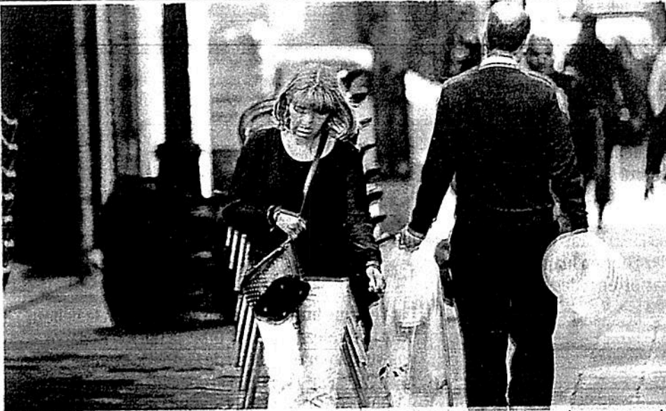
Ante la inseguridad, es común que las ciudadanas protejan el bolso mientras caminan/MAURICIO HUIZAR