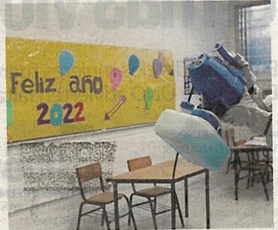
La desinfección de cada una de las escuelas dura aproximadamente una hora.

En Azcapotzalco, Fundación Cabarroca brinda servicios de sanitización a instituciones públicas y privadas para garantizar que los alumnos y maestros no se contagien