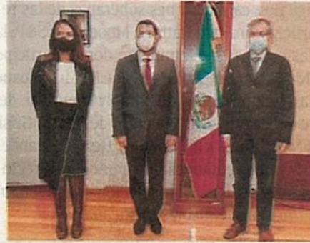
Martí Batres presentó los cambios