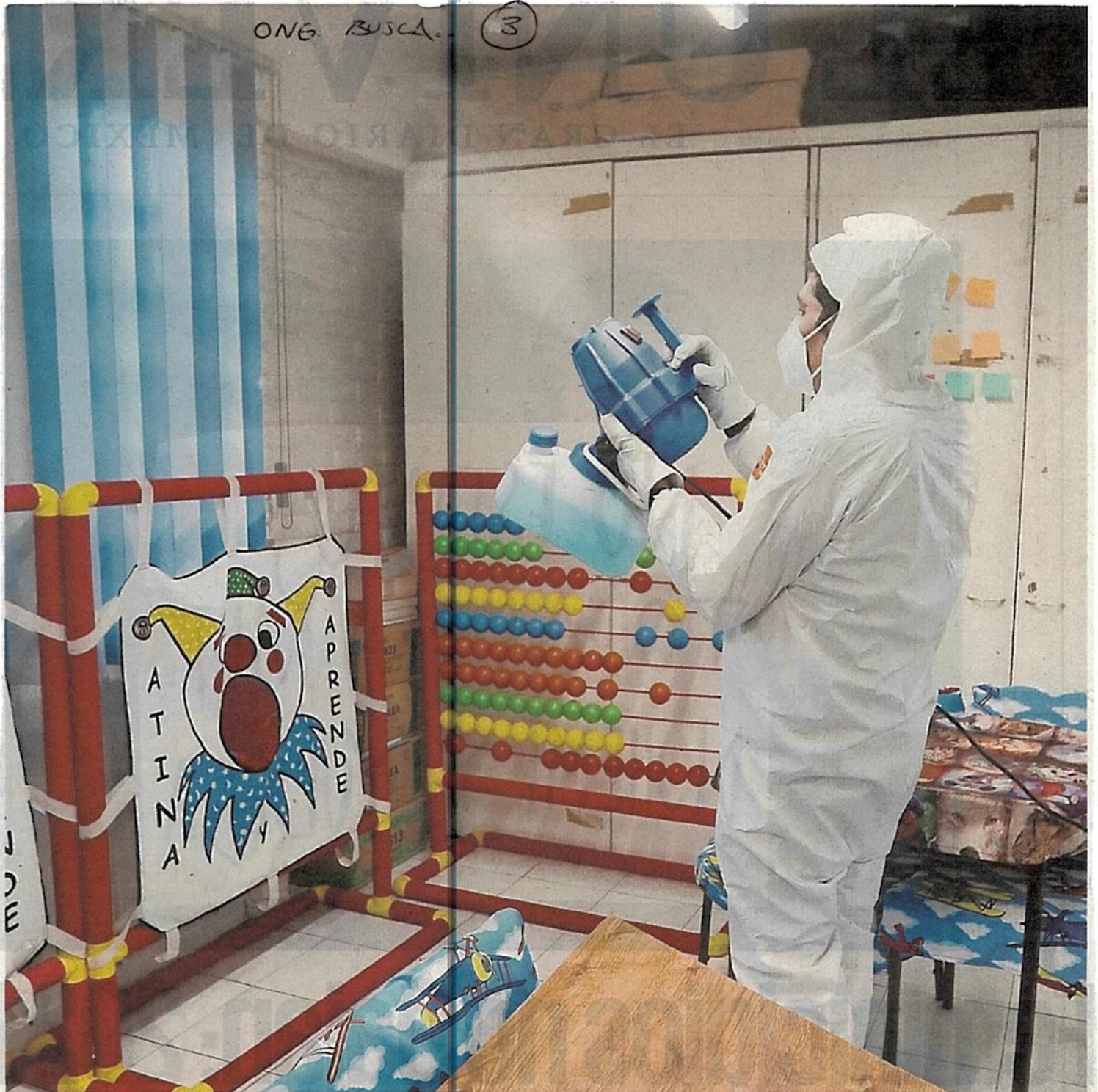
Para desinfectar se utiliza una solución salina isotónica en nebulizadores; para el equipo de fumigación y rociado electrostático se emplea agua mezclada con alcohol, lo que no representa ningún riesgo para los niños; gracias a eso, el activo funciona hasta por una semana.