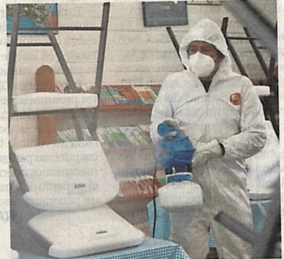
Todos los gastos de la limpieza corren a cargo de la fundación.