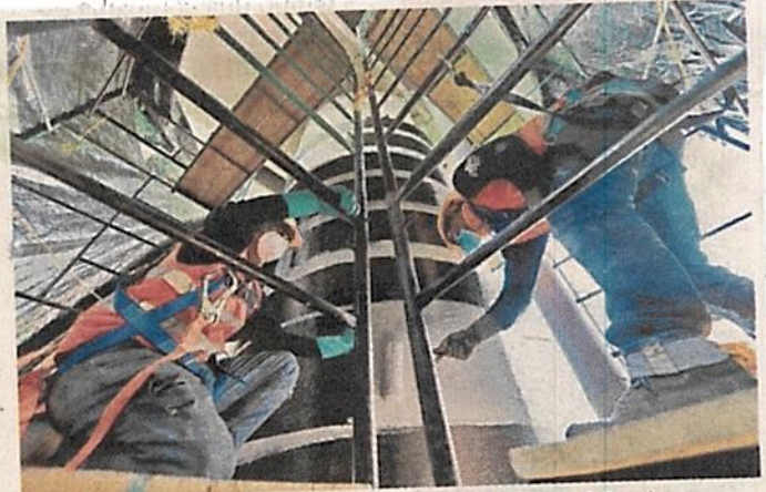
■ Expertos recomendaron intervenir 152 de las 208 columnas.

brimiento de origen y el concreto se tiene que limpiar para nosotros identificar las grietas y las indicaciones que puede tener este concreto”, explicó el académico de la UANL.