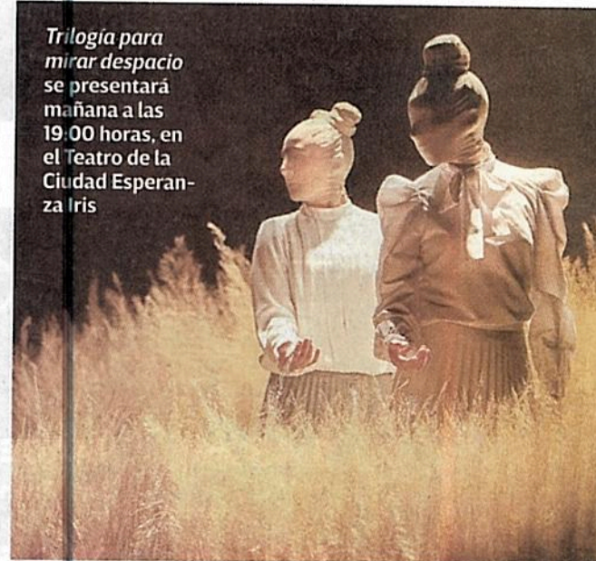
Trilogía para mirar despacio se presentará mañana a las 19:00 horas, en el Teatro de la Ciudad Esperanza Iris

Así lo informó ayer la Secretaría de Cultura de la Ciudad de México, la cual confirmó que mantendrá abiertos los recintos museísticos del Instituto Nacional de Bellas Artes y Literatura