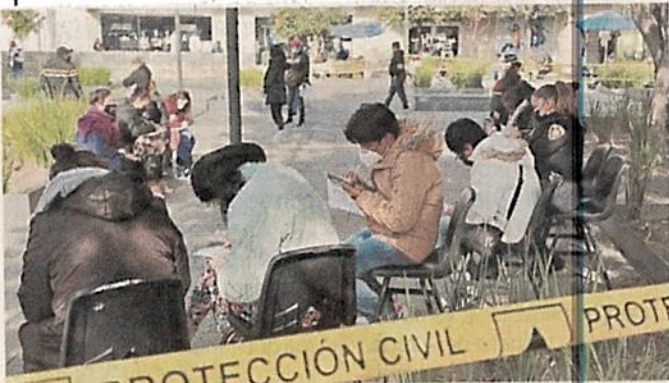
Personal del quiosco detalló que tener sospechas y buscar un test aumenta la posibilidad de contagiar a otros.