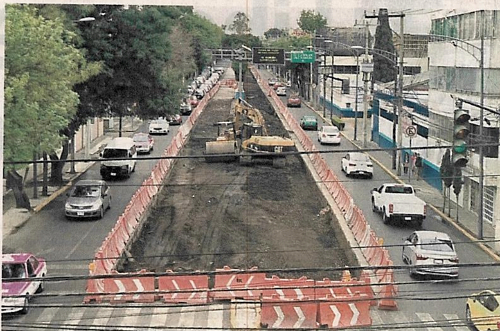
■ Vecinos cuestionan la pertinencia de una estación, pues se estima mil 678 usuarios en día hábil.

“También servicios de emergencias hacen uso de esta avenida y ya ha habido emergencias, y no ha pasado el camión de bomberos,