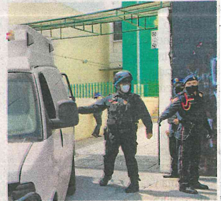
El cuerpo, identificado por un familiar quien dio versión de los hechos una vez perder contacto

Tras confirmarse la identidad del occiso, varias personas bloquearon Avenida Constituyentes, para solicitar una reunión con el titular de la Secretaría de Seguridad Ciudadana (SSC) de la Ciudad de México, Omar García Harfuch. Tras múltiples labores de inteligencia, se estableció que posiblemente, varios policías preventivos estarían relacionados directamente con la privación ile-