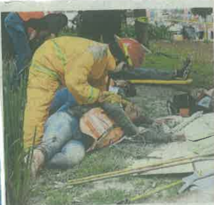
En Paseo de la Reforma, recrearon situaciones de emergencia reales.

pasarán para el siguiente simulacro en la CDMX. Se harán desde ahora por trimestres, informó Sheinbaum.