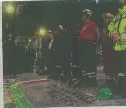
Brigadistas de 1985 montaron una guardia en la Plaza de la Solidaridad.