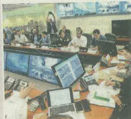
Desde el C5 capitalino, Sheinbaum recibió los resultados del ejercicio.