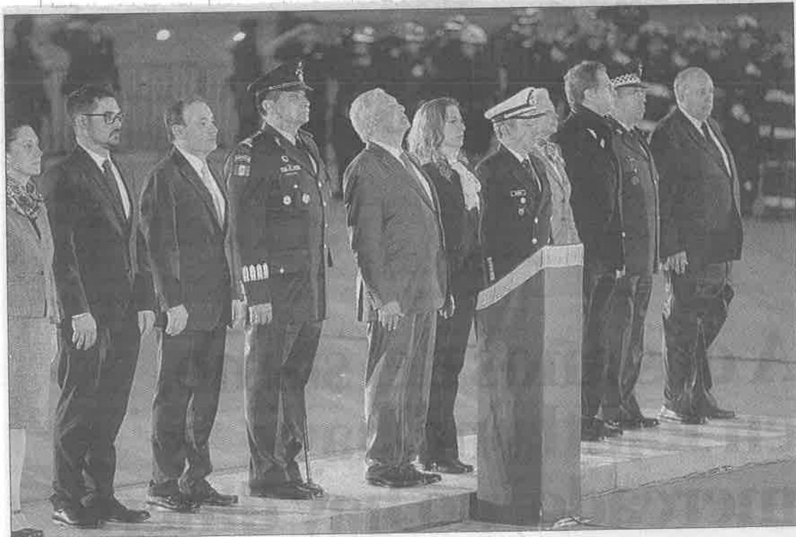
▲ El presidente Andrés Manuel López Obrador izó a media asta el lábaro patrio monumental en el Zócalo capitalino, en compañía de su esposa, Beatriz Gutiérrez; la jefa de Gobierno, Claudia Sheinbaum, y secretarios de Estado.

Sorpresivamente, justo a las 13:14, coincidente con la hora en que la tierra se cimbó hace dos años, un helicóptero de la Fuerza Aérea Mexicana descendió en el Zócalo. Será parte de la Feria de Protección Civil que se inicia hoy.