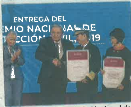
AMLO entregó el Premio Nacional de Protección Civil 2019, en Palacio.

26 PERSONAS presentaron lesiones menores, crisis nerviosa, desmayos, esguinces y una fractura.