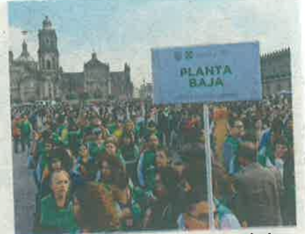
A las 10 de la mañana, se realizó el Macro simulacro en 18 estados.