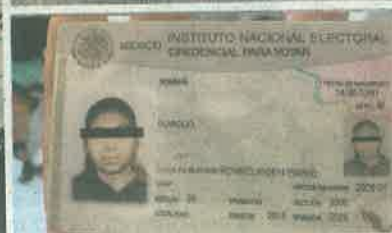
Agentes de la SSC encontraron rastros de sangre sobre el colchón y el piso, así como credenciales y una supuesta carta del presunto homicida.