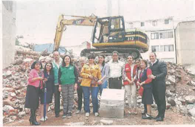
Vecinos y autoridades celebraron la colocación de la primera piedra de los nuevos edificios en la Narvarte.

“A todos se les debe apoyar por igual”, les aseguró la Jefa de Gobierno, Claudia Sheinbaum, al visitar en agosto el predio de Rébsamen 249, y rechazar así la petición para reconstruir, a fondo perdido, departamentos de clase media, de mayor costo al promedio.