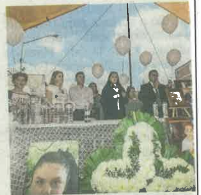
Con una misa, recordaron a las víctimas del Colegio Rébsamen.