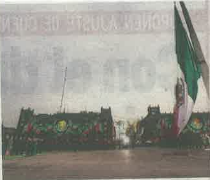
El Presidente encabezó la ceremonia conmemorativa en el Zócalo CDMX.