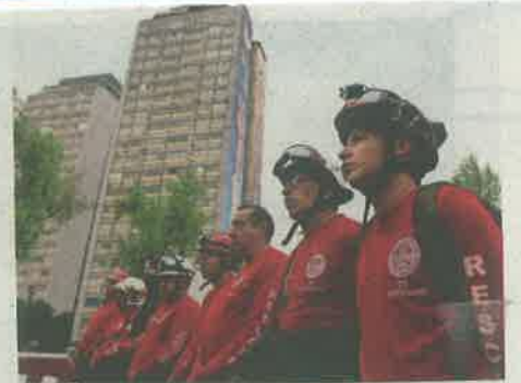
Tlatelolco recordó a los caídos de los terremotos de hace 34 años.