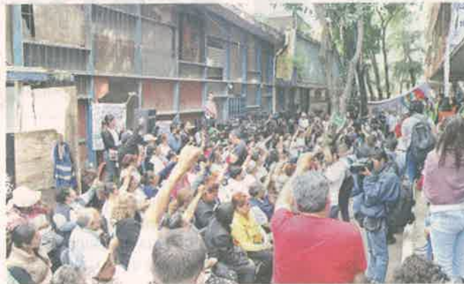
■ Los asistentes alzaron el puño en señal de silencio.

Por turnos, los manifestantes se quejaron de que, a pesar de las decenas de reuniones y acciones anunciadas