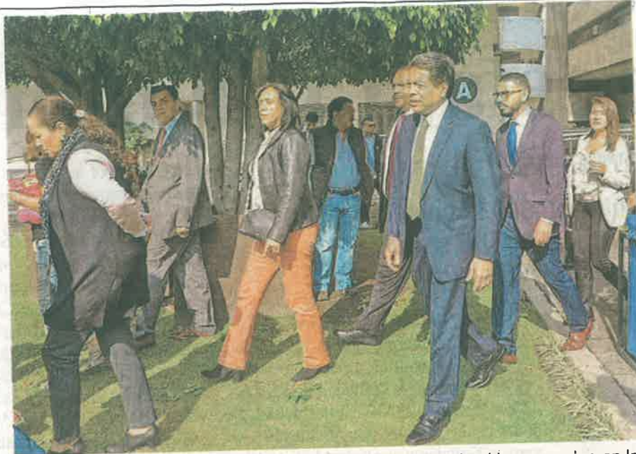
El diputado Mario Delgado sostuvo: "estamos recuperando el buen camino en la ciudad"

importante en materia de seguridad, en que regrese la disciplina, la integridad a los cuerpos de seguridad, que se tenga una estrategia para recuperar la paz y la tranquilidad en la capital de la República.