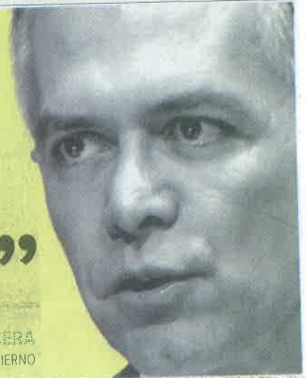
MIGUEL ÁNGEL MANCERA SENADOR Y EXJEFE DE GOBIERNO