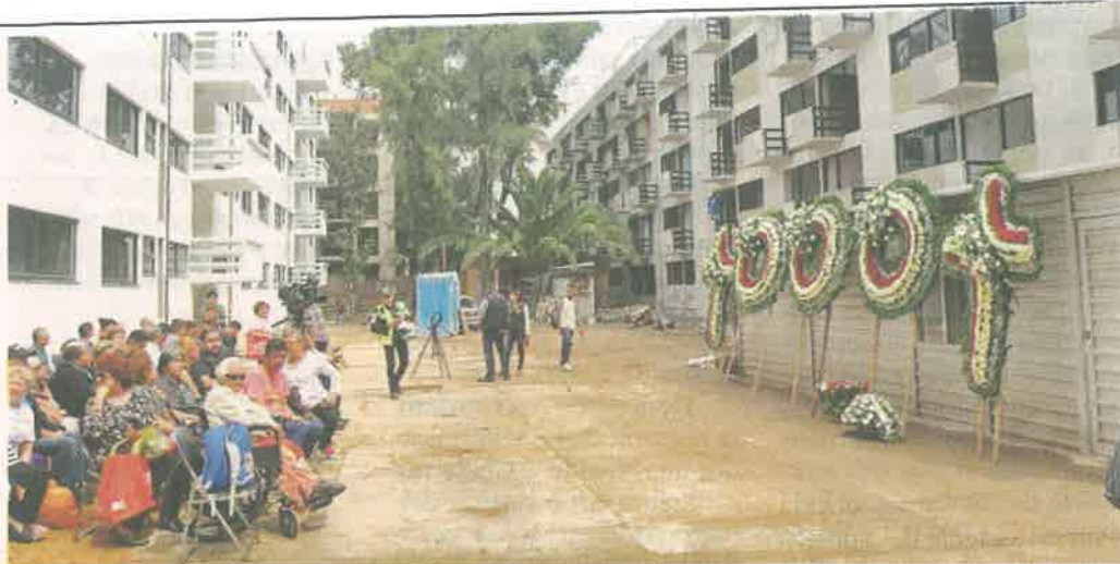
■ A dos años del sismo, ayer se realizó una misa en el Multifamiliar Tlalpan.