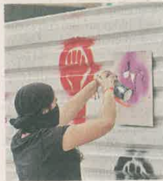
■ Activistas hicieron pintas en los tapiales de monumentos.