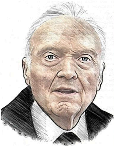
Alejandro Gertz Manero

C on 17 gubernaturas aseguradas para finales del presente año, la 4T ensaya los métodos para acabar con los blindajes que pretenden dejar a su paso los mandatarios de oposición, en especial para sustituir a los fiscales transexenales que heredarán los nuevos gobiernos.