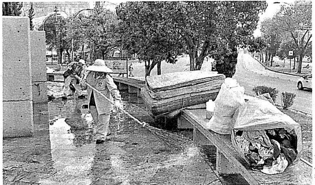
■ Cerca de 25 espacios públicos son intervenidos por 16 personas de la cuadrilla de limpia.

Se trata de la Plaza José San Martín, en el cruce de Paseo de la Reforma y Eje 1; la Plaza Zarco, colindante al Templo de San Hipólito; el Monumento a Simón Bolívar, entre Reforma y Violeta; fren-