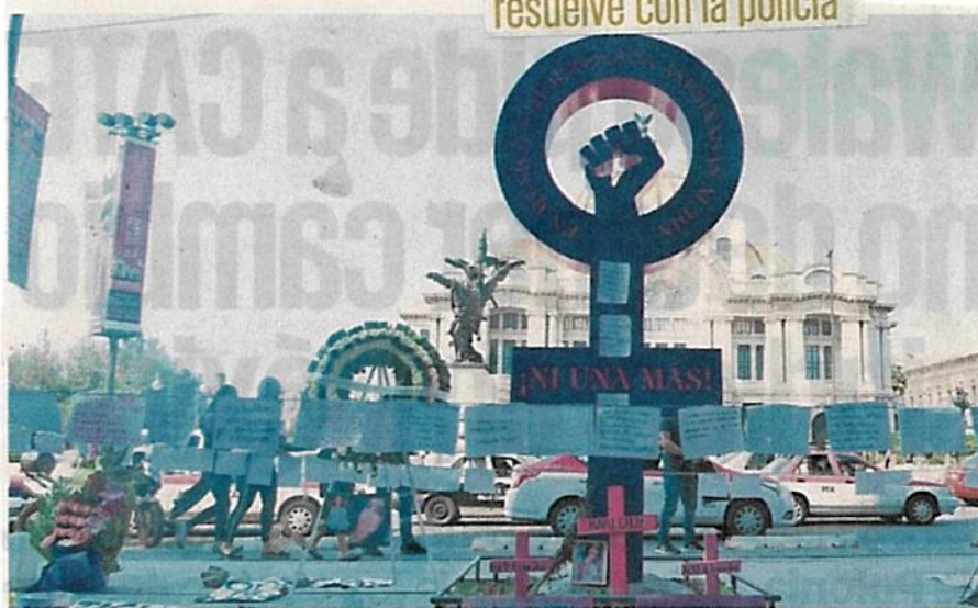
Para resolver el problema de feminicidios se requiere la colaboración de diferentes áreas de gobierno, no solamente le corresponde a la policía, dijo el director del ONC.

de feminicidio reporta Tlalpan; es la alcaldía con mayor número de muertes violentas por razones de género.