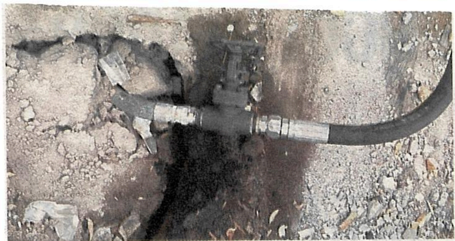
Y siguen apareciendo las tomas

de la población que habita Tlalpan vive en pobreza extrema