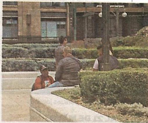
A la luz del día estafan a la gente