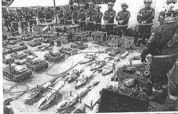
En un evento en la glorieta de Insurgentes, los cuerpos de emergencias que participarán en el ejercicio realizaron el pase de lista y verificaron su equipo.