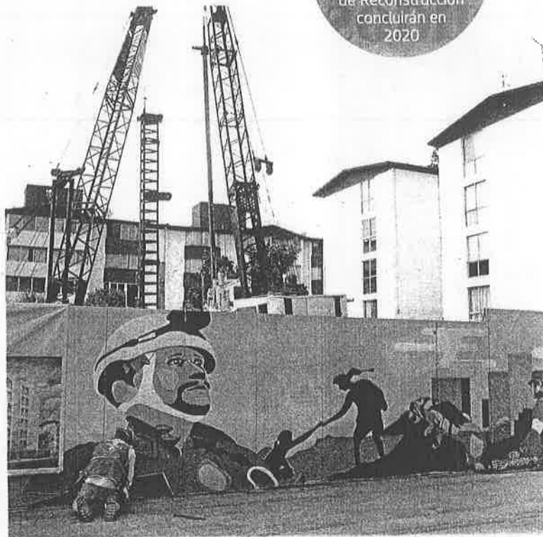
A nivel nacional aún hay 186 mil 526 viviendas, 19 mil 198 escuelas, 297 hospitales y 2 mil 340 recintos culturales dañados

De estos, 726 millones corresponden al Presupuesto de Egresos de la Federación 2019, 5 mil 14 millones al Fondo de Desastres Naturales, 759 millones al cobro de seguros y cuatro mil 39 millones a distintas fuentes de financiamiento.