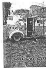
Ilcico. A la unidad de traslado de valores le retiraron la puerta con un soplete para robar el efectivo.

"Los focos se encendieron tras la detención de cuatro elementos de seguridad el 9 de septiembre por omisiones en protocolos de la empresa"