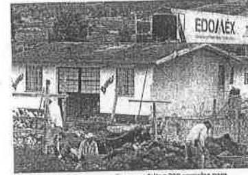
Las autoridades investigadoras dicen que faltan 300 cuerdas para rehabilitar, pero el IMIFE asegura que son 245.

CLAUDIA GONZÁLEZ y EMILIO FERNÁNDEZ Corresponsales @metropoli@eluniversal.com.mx