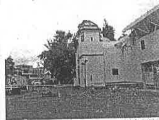
Al ver la iglesia de San Gregorio Atlapulco y el entorno pareciera que el sismo fue apenas hace unos días.