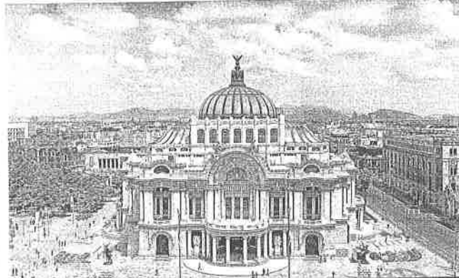
AZUL CELESTE CUAUHTÉMOC. Aunque por la tarde y noche se registraron lluvias en algunas zonas de la Capital, desde temprano se pudo disfrutar de postales con cielo parcialmente nublado, pero con un azul sin contaminación.

A pesar de las lluvias registradas en el País y en la Ciudad por la tormenta tropical "Lorena", la zona centro de México sigue afectada por la sequía, informó la Comisión Nacional del Agua (Conagua). "El promedio anual de lluvias en el Valle de México es de 800 milímetros, no ha terminado la temporada, de lo que esperábamos de enero al 15 de septiembre, sólo tenemos 60 por ciento", expuso Jorge Zavala, director del Servicio Meteorológico Nacional. Aunque ha llovido, en términos técnicos hay una condición de sequía también en la región de las siete presas abastecedoras del Sistema Cutzamala, explicó Blanca Jiménez, directora de Conagua. "La situación del Sistema Cutzamala no ha cambiado. Las presas siguen sin incrementar el llenado, tienen 75 por ciento de almacenamiento", expuso la titular de Conagua. Por lo tanto, el recorte iniciado el jueves 12 de septiembre en el suministro del Cutzamala a la Capital continuará, precisó. "Cuando una presa está al 70 por ciento no puede uno bajarla, porque la función de Conagua es asegurar que esa cantidad que tenemos almacenada nos alcance para todo el año, lluvia o no", subrayó Jiménez. La funcionaria explicó que aun cuando influyen lluvias fuertes en el centro del País, los torres de las tormentas tropicales se quedan en las zonas costeras.