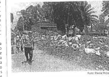
Las escenas de cascajo y tierra entre yerba se repiten en las calles de éste que es uno de los pueblos originarios de la ciudad

"Me fui a inscribir para lo de la casa, y me dijeron que sí, apenas antes fui a junta y me dijeron que si que nos van a volver a ayudar, el gobierno de la Ciudad de México. No nos prometió la casa que tenemos, pero, aunque sea unos dos cuartos nos iban a hacer".