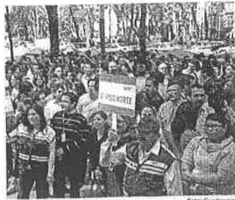
El sonido que se emitirá será el real de una alerta sísmica y también lo transmitirán estaciones de radio y televisión.