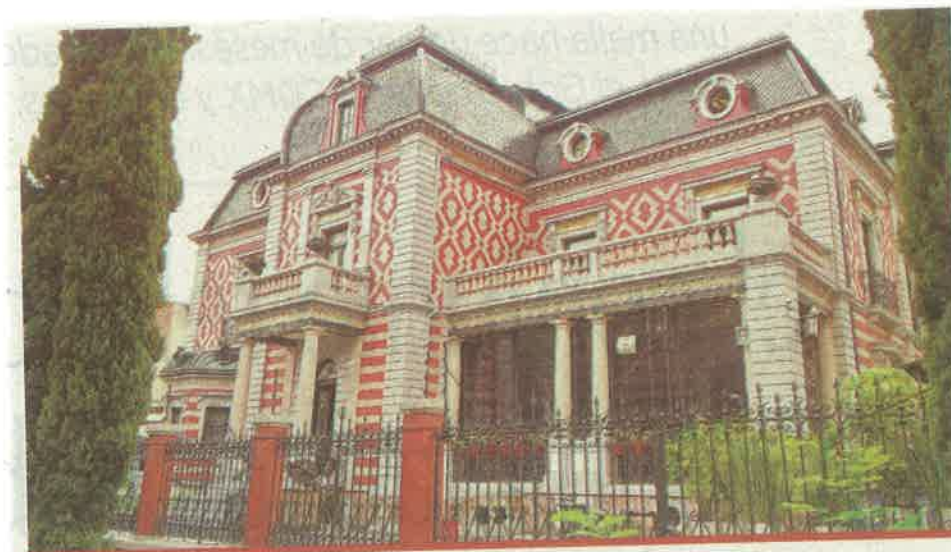
El Museo de Cera ubicado en la calle de Londres es uno de los atractivos de la colonia Juárez.

pre nuevos restaurantes, galerías, bares y tiendas en medio de la arquitectura característica del Porfiriato. Si quieres salir de la Roma y la Condesa, la Juárez te espera con opciones para que disfrutes de buena comida, bebida y diseño de interiores".