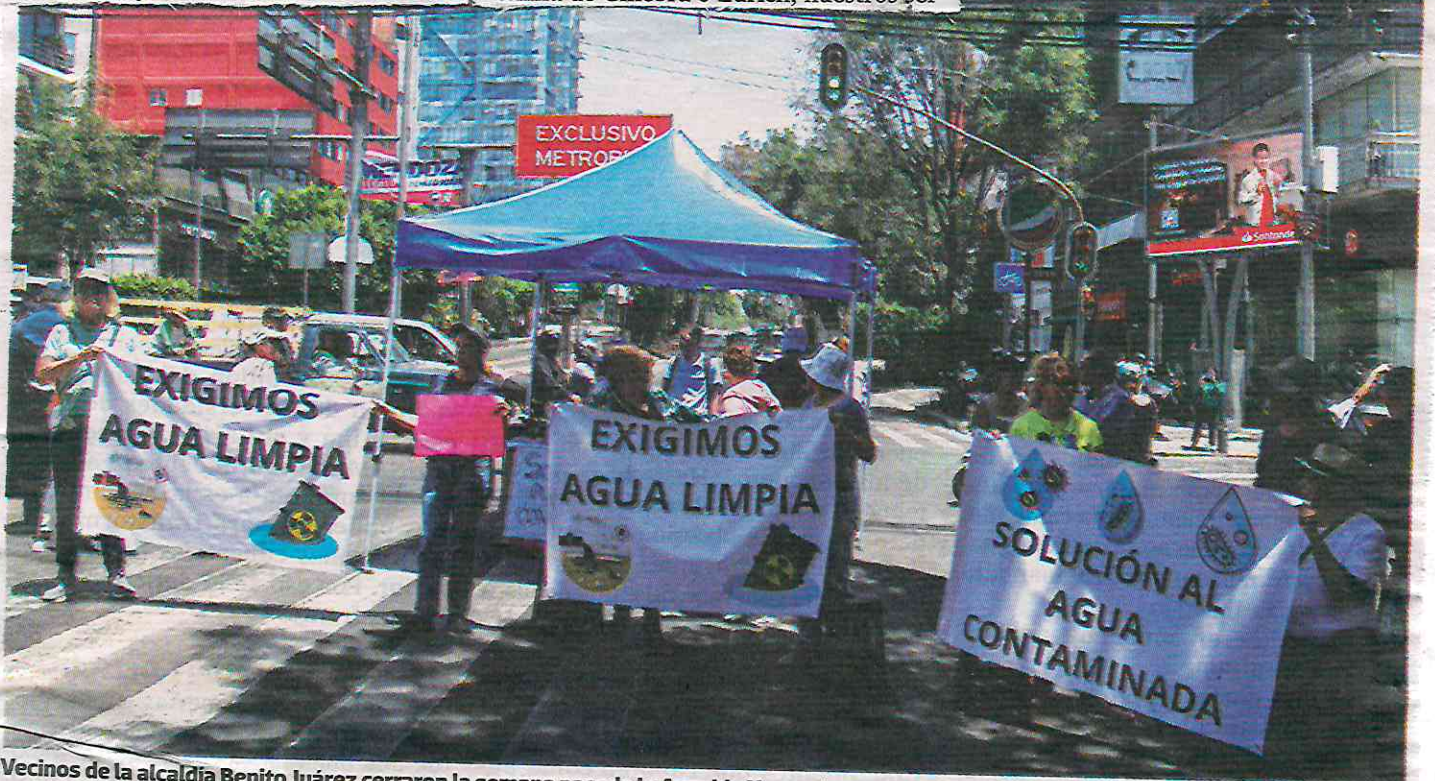
Vecinos de la alcaldía Benito Juárez cerraron la semana pasada la Avenida Xoco e Insurgentes para protestar por el olor a químicos en el agua.

vicios médicos rebasan a los de Escandinavia y el agua limpia y pura colma las piscinas de nuestro entusiasmo, porque tenemos una feliz ciudad verde, arbolada, donde las palmeras se mueren de pura dicha y feliz crece el bosque circundante protegido de incendios o talamontes, por la Cuarta Transformación, porque los quejosos, quienes dicen hallar peste y residuos urticantes y aceitosos en el agua, tóxica para beber y hasta para lavar calzones, son “aspiracionistas” de la colonia Del Valle quienes han sido comprados por los adversarios de la lucha proletaria para protestar por imaginarias poluciones hídricas no obstante lo cual ahí vemos los camiones militares, las plantas potabilizadoras de la Marina, la vigilancia de la Guardia Nacional y las cisternas móviles dispensando garrafones recién lavados para despojarlos de ponzoña, porque