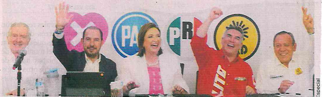
■ Santiago Creel, el dirigente del PAN, Marko Cortés, la abanderada presidencial, Xóchitl Gálvez, el líder de PRI, Alejandro Moreno, y el perredista Jesús Zambrano después de una reunión.

La candidata presidencial de la coalición Fuerza y Corazón por México recibió en el cuartel de campaña al panista Marko Cortés, al priista Alejandro Moreno y al perredista Jesús Zambrano, y luego, vía zoom, entró en contacto con jefes estatales y xochilovers.