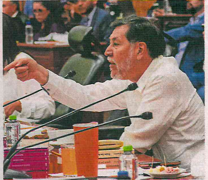
Gerardo Fernández Noroña se levantó de su lugar y señalando al senador perredista, dijo: "¡No te voy a tolerar tus majaderías!".