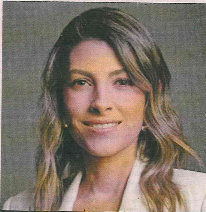
Sylvana Beltrones, Senadora del PRI

Esto es un golpe a los derechos colectivos, como es el caso de temas ambientales,