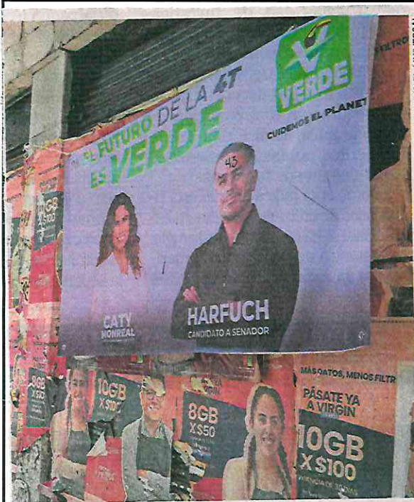
Los candidatos de Morena y aliados encabezan las listas de gastos en campañas.

ra el Senado va de los 4 millones 406 mil 525 pesos hasta los 44 millones 65 mil 248 pesos, dependiendo del estado donde se contienda.