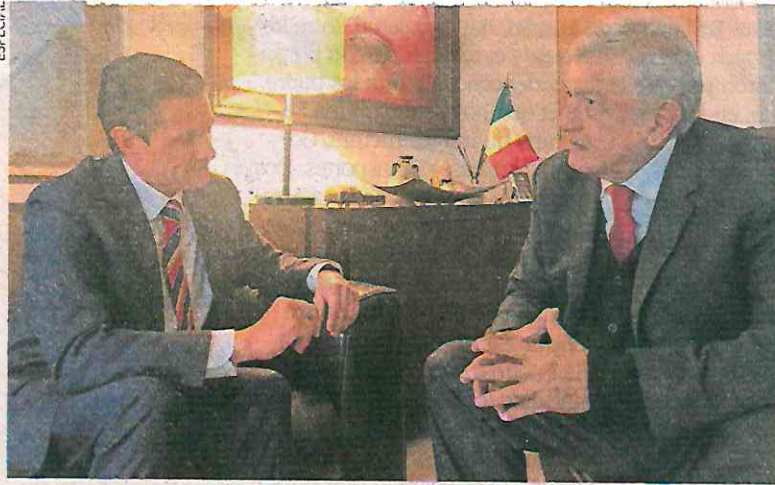
El encuentro se realizó en la casa de López Obrador en Tlalpan.