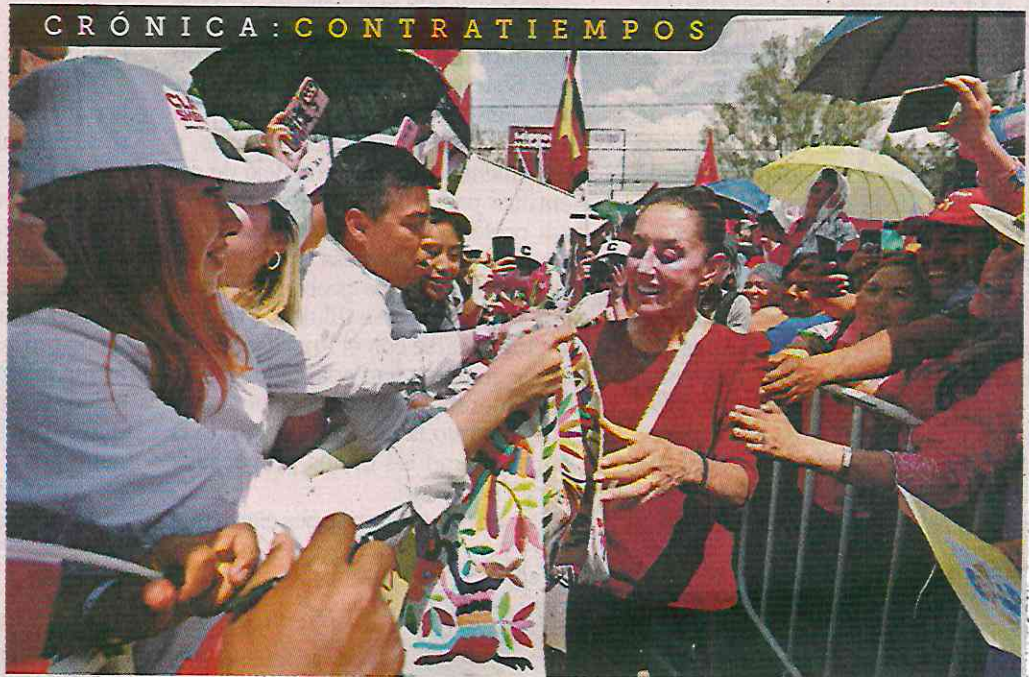
La candidata presidencial de la alianza Morena-PT-PVEM se reunió ayer con simpatizantes en Actopan y Zempoala, Hidalgo.