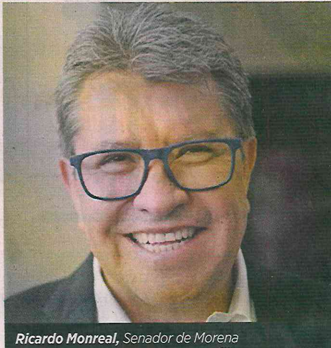
Ricardo Monreal, Senador de Morena

La propuesta surge como respuesta a una problemática identificada en la interpretación y aplicación de la Ley de Amparo vigente, particularmente en lo que respecta a la suspensión de normas generales. Para empezar, debemos considerar que en México la elaboración de normas generales implica un proceso legislativo en el que partici-