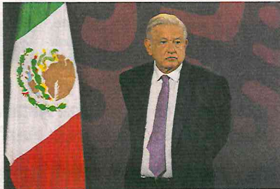
CARLOS MEJÍA, EL UNIVERSAL

Añadió que el Poder Judicial ha declarado como inconstitucionales leyes que ha presentado su gobierno, porque no se cuidó el procedimiento legislativo. ●