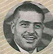
OMAR GARCÍA HARFUCH (SHH)