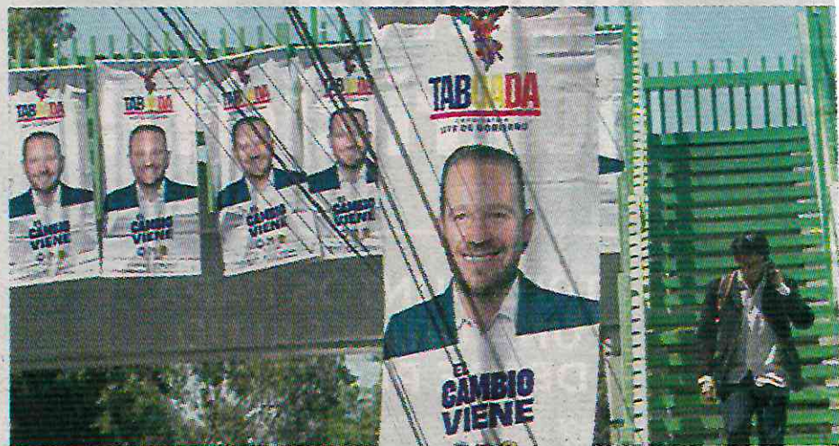
El abanderado de "Va por la CDMX" despilfarró casi 22 millones de pesos

A 46 días de iniciadas las campañas, la alianza PAN-PRI-PRD ya desembolsó 21 millones 821 mil 136 pesos en propaganda. Esto representa el 45% del total de los 47 millones 997 mil 263 pesos reportados por todos los partidos que compiten por el mismo cargo en la capital del país.