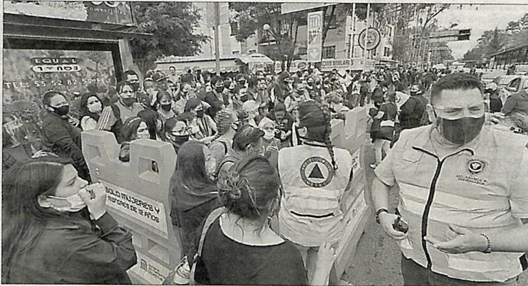
▲ Miembros de Protección Civil coordinaron a los usuarios afectados para poder tomar un camión que los llevara a su destino, luego del cierre de varias estaciones de la Línea 3.