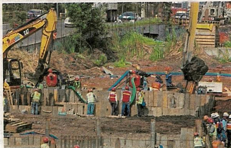
No pueden intervenir el humedal, sea artificial o NO /ADRIÁN VÁZQUEZ

"En primer lugar, para 2004, fecha de la asignación del sitio, ya existía dicha formación y en segundo lugar, el propio tratado prevé el derecho de cada contratante para solicitar retirar de la Lista o reducir los límites de los humedales ya incluidos, informando sobre estas modificaciones lo más rápidamente posible al gobierno responsable lo que la autoridad a la fecha no acredita haberlo llevado a cabo", se señaló.