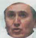
Luis Raúl González P.

En el Senado alistan la publicación de la convocatoria para renovar la titularidad de la CNDH. El coordinador parlamentario de Morena, Ricardo Monreal se reunió con el actual ombudsman, Luis Raúl González Pérez, para hablar sobre el proceso. Por ley, González Pérez tiene posibilidad de reelegirse, pero nos dicen que no se postulará.