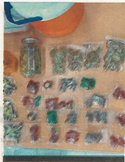
El presunto narcomenudista traía surtido de posible droga, ya lo investigan