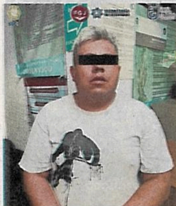
El sujeto fue trasladado a un centro penitenciario de la CDMX.

Samuel Ríos fue asesinado de un balazo en la cabeza en un intento de asalto cuando circulaba, acompañado por su novia, sobre el Eje 7 Sur calle 2 Poniente. ●