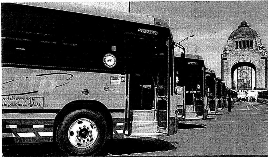
De las 118 unidades nuevas, 70 autobuses serán de media montaña.

Finalmente se informó que se sancionará a la empresa Volvo por el incumplimiento de la entrega de 70 unidades nuevas, que debieron entregarse el 30 de junio del presente año.