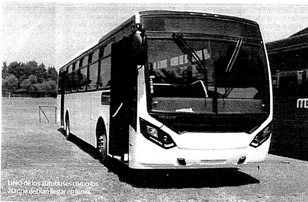
UNO de los autobuses como los 70 que debían llegar en junio.