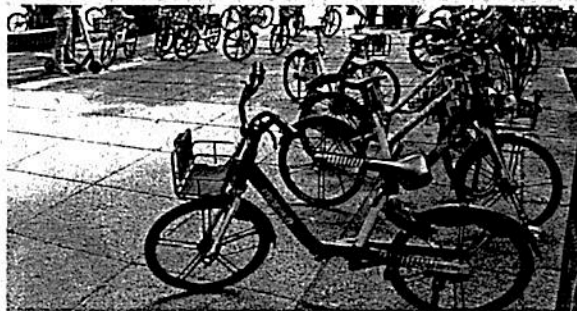
CHOQUE. En Twitter, la empresa y la Semovi tuvieron un encontronazo ante los cuestionamientos de un usuario.

Queridos #Mobikers, en estos últimos días, se han compartido #FakeNews acerca de Mobike y de nuestra operación en la #CDMX. Comunicamos que CONTINUAMOS OPERANDO con éxito en más de 20 países y 200 ciudades, entre ellas México y Santiago de Chile.