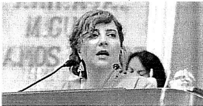
■ Salido ha presentado 33 puntos de acuerdo en el Congreso.

Un punto para indagar las obras de mitigación en Lago Alberto 320 y la promoción de un juicio de levisidad contra un certificado de uso de suelo en la Miguel Hidalgo son otros de los exhortos a las autoridades que ha presentado la diputada panista.