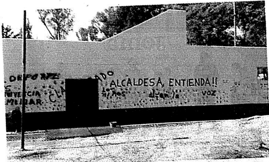
Van varios Intentos de la alcaldesa por apoderarse de extensas áreas en el deportivo, a lo que se oponen obregonenses