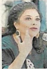
Clara Brugada Molina