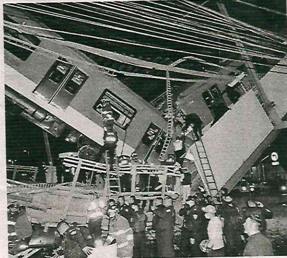
El 3 de mayo colapsó el puente elevado de la L12