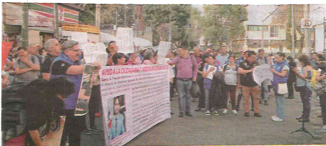
El caso fue presentado por Crónica el pasado 12 de febrero, como uno de los testimonios de trabajadoras que se manifestaron afuera de la FGJCDMX.

"Después de mi resolución hay otro ánimo, varias quieren denunciar; hubo una buena reacción en la Fiscalía hay muchas mujeres que sufren de acoso, pero no denuncian por miedo y no dejan su trabajo por necesidad, a una compañera la acosó su jefe en el Centro de Justicia para Mujeres de Iztapalapa, le dijo que la acompañara al sótano y la besó, ahí no hay ni señal de teléfono, derivado de que me vieron hablar, a partir de esto le van a iniciar su carpeta de investigación"•