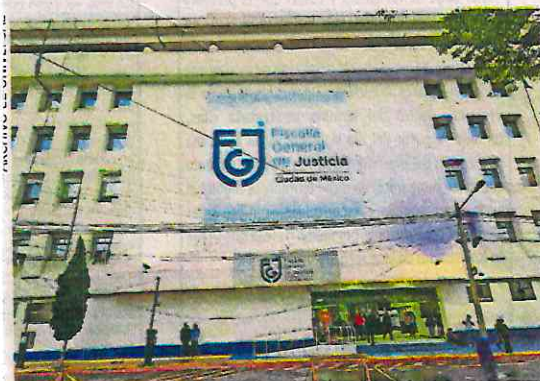
La FGJ informó en la Gaceta Oficial la creación de la agencia de delitos sexuales contra menores.

De acuerdo con el documento, toda carpeta de investigación que se inicie por alguno de esos delitos deberá derivarse a la FIDCANNA, para continuar con su investigación y la Agencia de Investigación segmentará y priorizará las carpetas entre sus Unidades de Investigación, de acuerdo con el tipo de delito y el nivel de riesgo en el que se encuentren las víctimas. ●