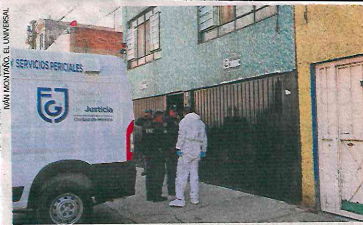
IVÁN MONTAÑO. EL UNIVERSAL