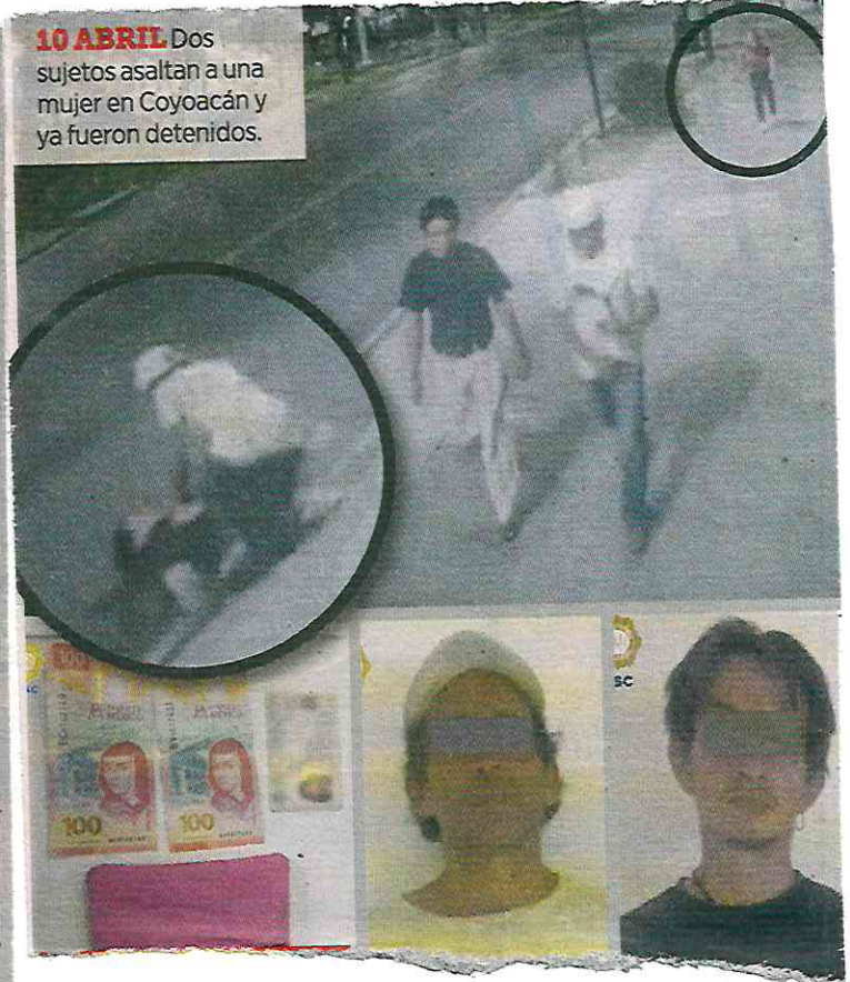
10 ABRIL Dos sujetos asaltan a una mujer en Coyoacán y ya fueron detenidos.

Debido a ello, las personas de 39 y 49 años de edad fueron detenidas y presentados ante el agente del Ministerio Público para definir su situación jurídica.