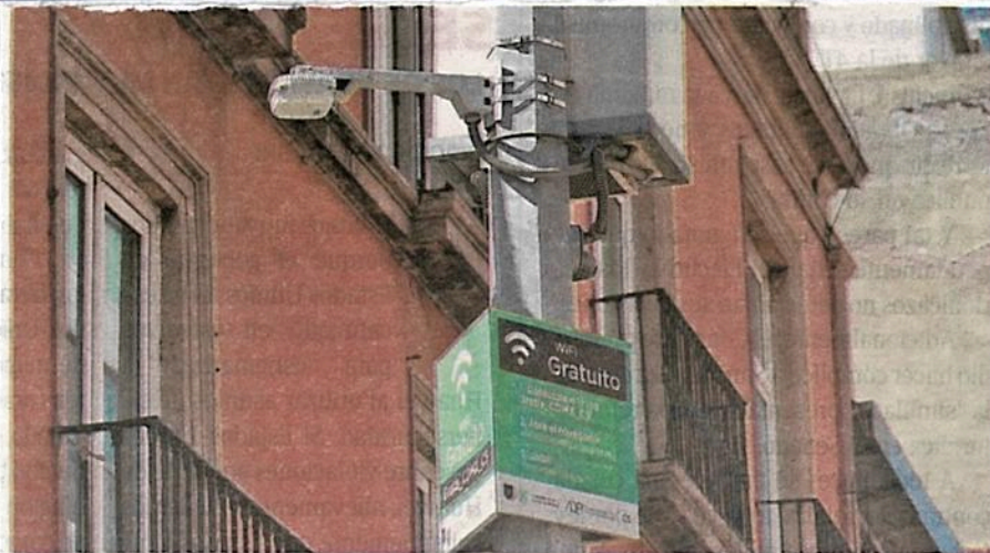
La ciberviolencia es la violencia mediática en las redes sociales contra las mujeres y niñas, y representa un obstáculo para su acceso seguro a las comunicaciones e información digital