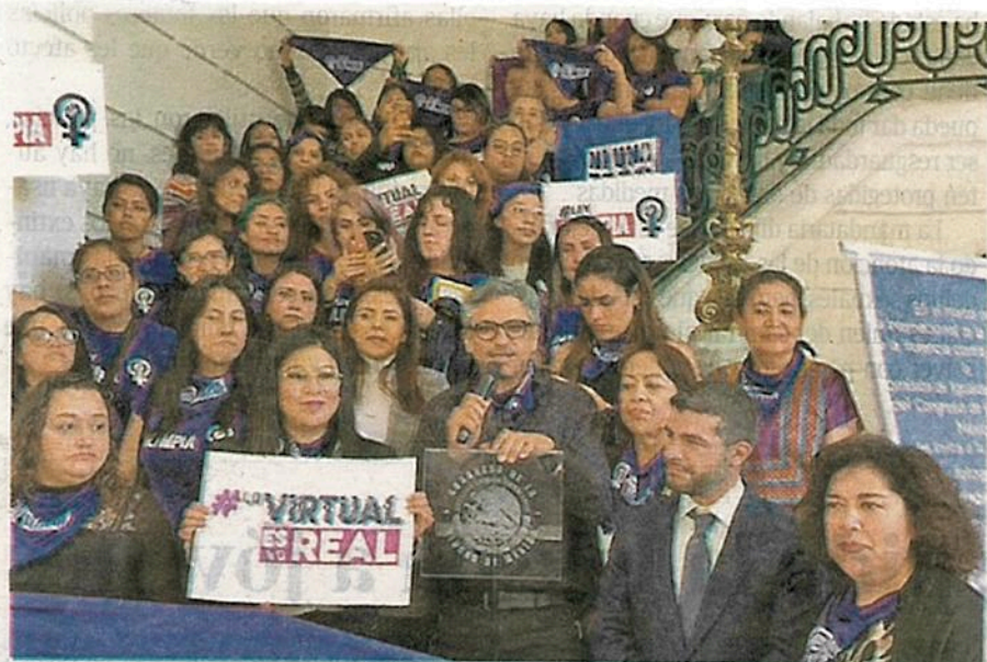
En la Ciudad de México, la Ley Olimpia es un gran avance para frenar la agresión que padecen las mujeres en el mundo digital

• El shaming como que últimamente se han empleado los términos fat-shaming y slut-shaming para nombrar aquellos actos