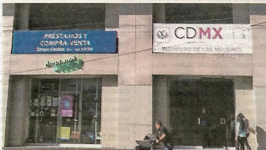
Hay mucho trabajo por delante en todos los ámbitos para asegurar a las mujeres una sociedad libre de violencia