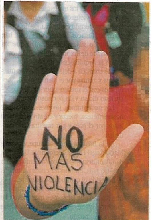
El comportamiento violento va desde el acoso infligir daño físico, incluidos los ataques sexuales