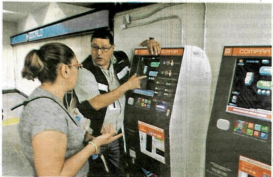
Esta usuaria recibe instrucciones de cómo recargar su tarjeta

Movilidad Integrada, tiene un costo de 15 pesos en las taquillas del Metro, más el costo de un viaje, es decir 20 pesos en total.