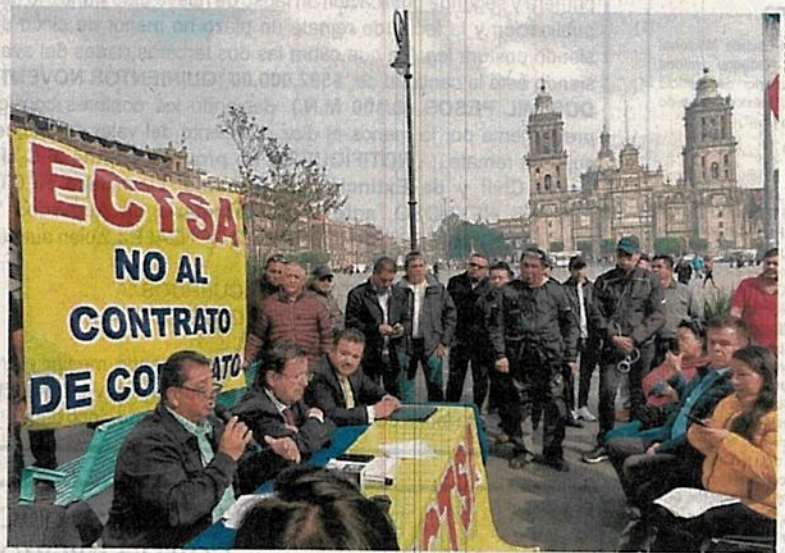
Concesionarios denunciaron que desde el órgano descentralizado del Metrobús han incorporado de manera ilegal a la empresa COETSA.