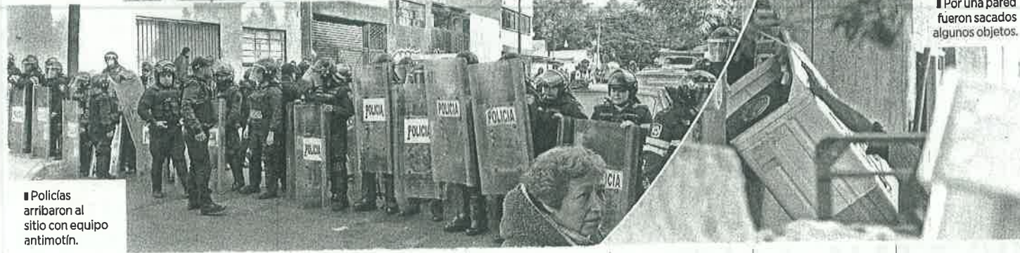
Policías arribaron al sitio con equipo antimotín.