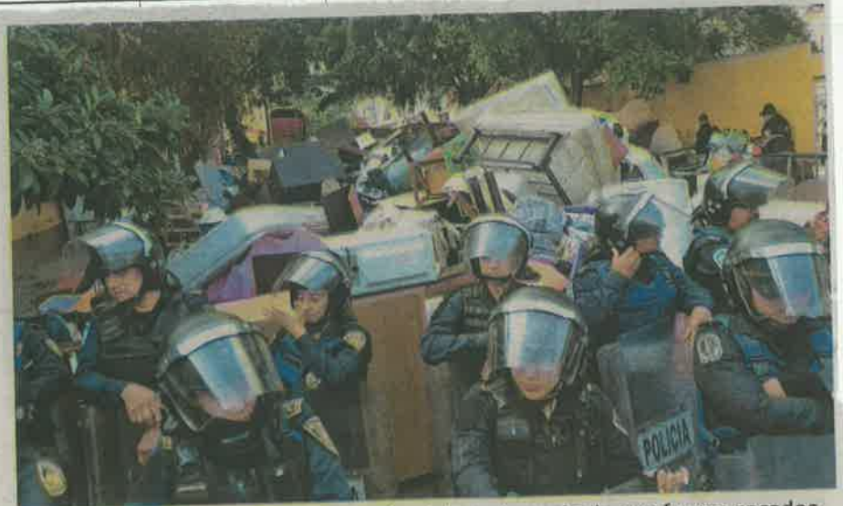
Policías resguardaron el mobiliario desalojado después de que fueron sacados los habitantes del inmueble

Personal de la Cruz Roja, del ERUM y de Protección Civil de Álvaro Obregón hicieron presencia en el lugar para atender a los heridos, de donde trasladaron a varias personas al nosocomio, entre ellos a dos menores de edad, quienes defendían sus