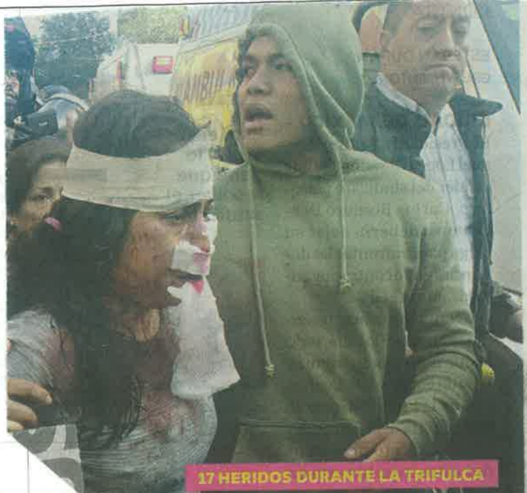
17 HERIDOS DURANTE LA TRIFULCA