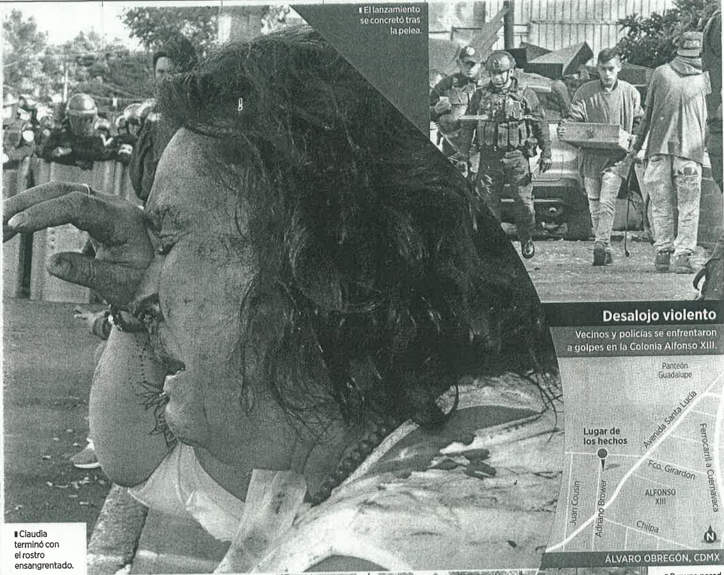
El lanzamiento se concretó tras la pelea.