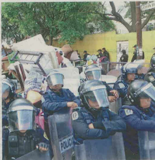
OPERATIVO. Policías capitalinos se protegieron del fuego cuando intentaron entrar al edificio; posteriormente resguardaron la calle y las pertenencias de las personas desalojadas. El edificio se encontraba en litigio desde hace años por un presunto despojo.

Caso. Presuntamente, el inmueble se encontraba invadido por el grupo de choque de los Claudios desde 2012 y estaba en litigio