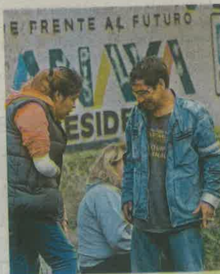
Algunos vecinos resultaron heridos durante la trifulca por el desalojo

mochilas escolares de los golpes y jalones de los policías.