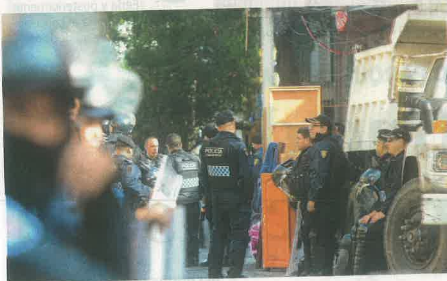
Policías quedaron fuera de inmueble para evitar que los vecinos regresen a las viviendas