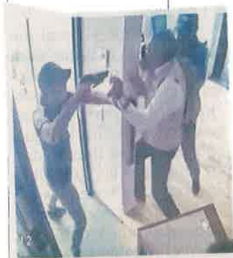
El ataque ocurrió el sábado.