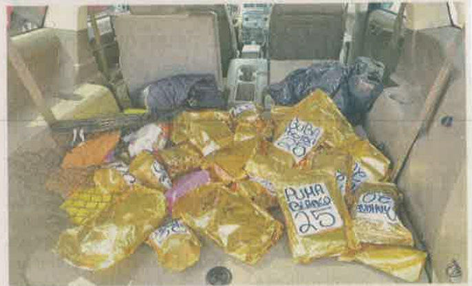
En la cajuela de una camioneta en la que intentaron huir, los detenidos llevaban 15 kilos de mariguana.

La Policía desplegó un operativo y luego de una breve persecución, fueron detenidos a bordo de una camio-