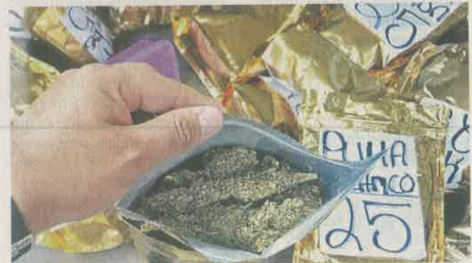
La droga la tenían empacada en bolsas doradas e iban clasificada por su tipo y el costo de venta.