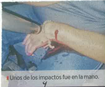
Unos de los impactos fue en la mano.