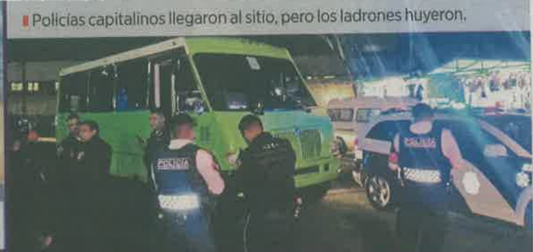
Policías capitalinos llegaron al sitio, pero los ladrones huyeron.