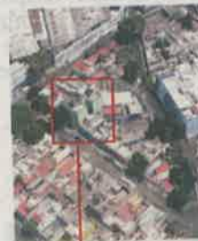
Edificio de 19 departamentos

Ésta es la ubicación del inmueble presuntamente invadido por los Claudias