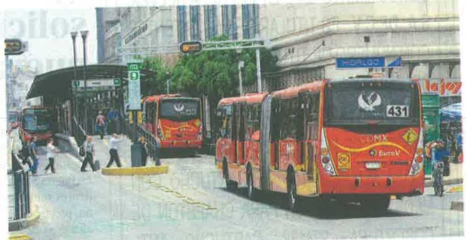
En total, de Tenayuca a Xoco, habrá 40 estaciones/FEDERICO XOLOCOTZI

Aunque el trazo planteado es que la extensión corra por carriles centrales del Eje 1 Poniente Cuauhtémoc hasta Río Churubusco, en la parte que pasa por el Pueblo de Xoco la Secretaría de Movilidad y el Metrobús tendrán que realizar una consulta con los vecinos, para que ellos determinen si avalan o no esta obra de transporte público.