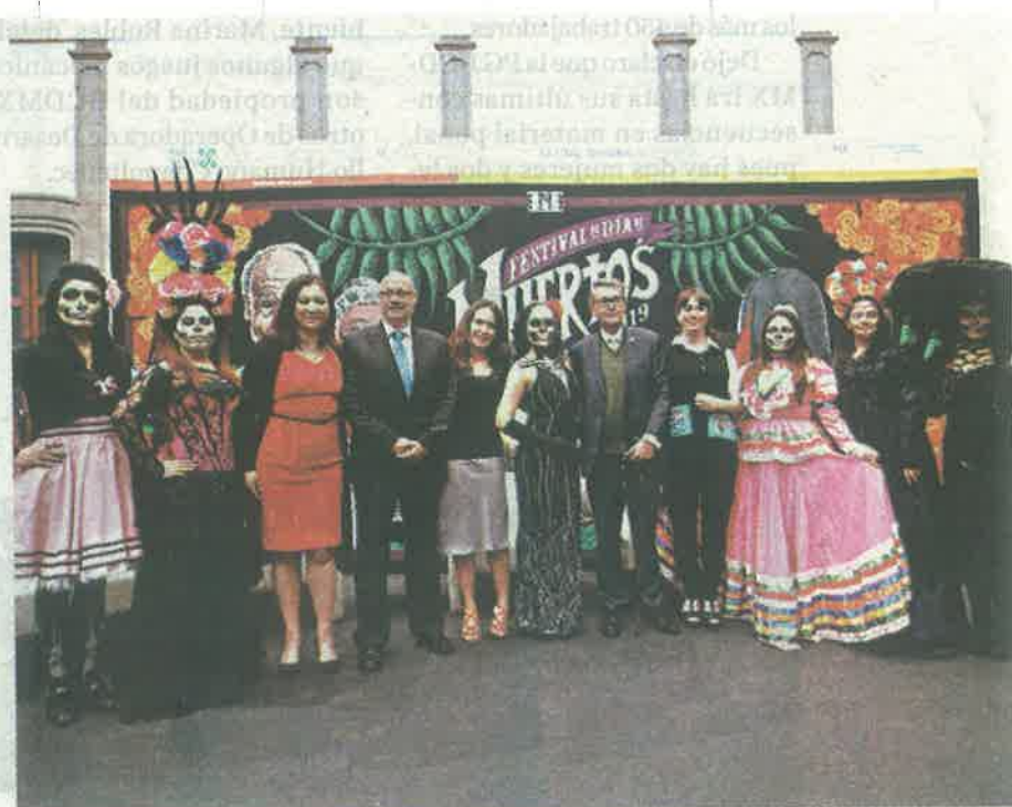
Escenificarán La Llorona, en Xochimilco

Por su parte, el Secretario de Turismo, Carlos Mackinlay, anunció que durante estas festividades se espera la visita de más de 2 millones de paseantes nacionales e internacionales, que dejarán una gran derrama económica para la Ciudad de México.