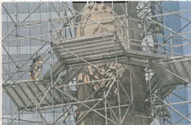
Las reparaciones se realizan tras los daños por el sismo del 19 de septiembre de 2017.

“En 2017 tuvo daños secundarios, pero no dejan de preocupar, porque la parte de