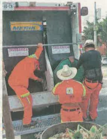
Sólo en 46 de cada 100 hogares se separa la basura