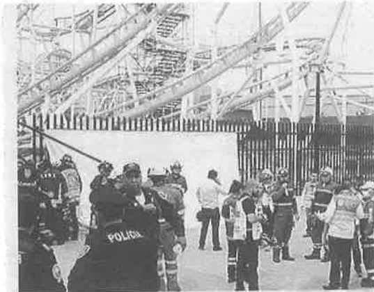
· Habrá verificadores internacionales