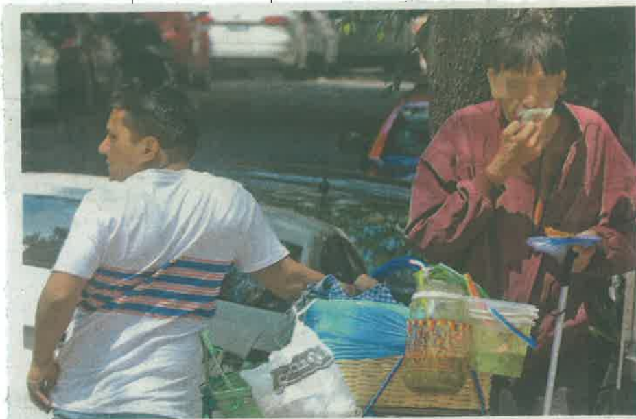
Debido a los bajos salarios que perciben los trabajadores en México han provocado malos hábitos alimenticios

Datos oficiales resaltan que en nuestro país, se desperdicia el 37% de los alimentos que se producen, equivalente a más de 10 millones 431 mil toneladas de alimentos al año y que servirían para evitar el hambre que padecen más de 7 millones de mexicanos, quienes en su mayoría enfrentan situaciones de pobreza y pobreza extrema.