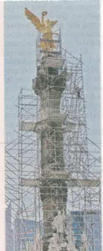
Los recursos para los arreglos aún no han sido liberados por la CDMX.