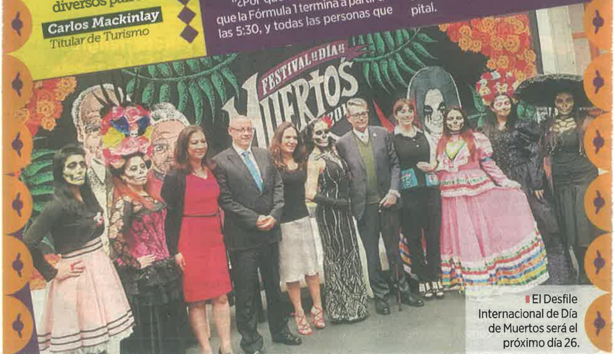
El Desfile Internacional de Día de Muertos será el próximo día 26.