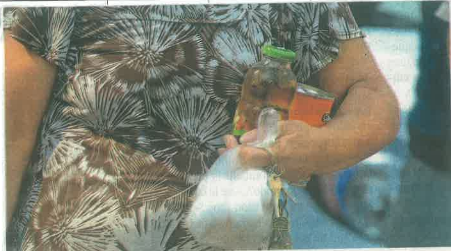
Muchos consumen alimentos que no los nutre, porque no les alcanza para adquirir carne, y sólo se conforman con huevo, frijoles y algún refresco