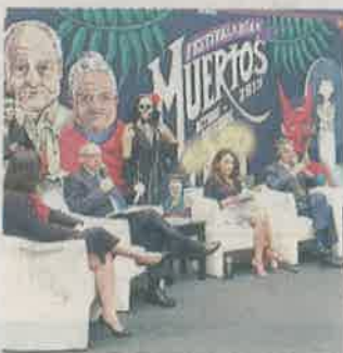
Las autoridades capitalinas anunciaron las actividades.

Debido a la Fórmula 1, el Desfile Internacional de Día de Muertos cambiará de ruta para que más turistas lo puedan admirar.