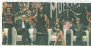
La Llorona, enmarcada en el Día de Muertos

En el evento participarán más de 50 artistas, el recorrido partirá a las 13:00 horas de la Estela de Luz, avanzará por Avenida Juárez, Eje Central y 5 de Mayo hasta llegar a la Plaza de la Constitución.