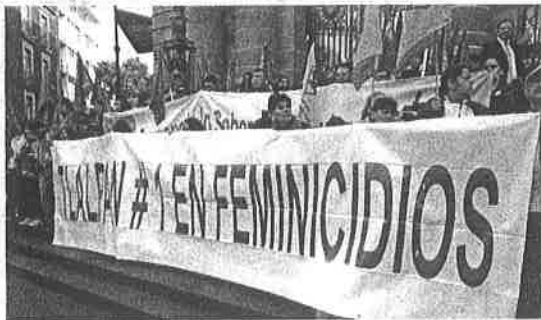
Habitantes de Tlalpan se manifestaron el pasado 14 de octubre afuera del Congreso de la Ciudad de México para que se declare la Alerta de Género.

La misma fuente señala que en Tlalpan, durante el lapso referido, se abrieron 55 carpetas de in-