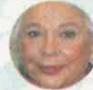
Olga Sánchez C.

Muchos aplausos recogió la titular de la Segob, Olga Sánchez Cordero, al decir que México está preparado para tener una mujer presidenta. Ella se descartó, pero ubicó como candidatas a la Jefa de Gobierno, Claudia Sheinbaum; la titular de la SFP, Irma Eréndira Sandoval; la secretaria de Bienestar, María Luisa Albores; a Josefina Vázquez Mota y a Patricia Mercado.