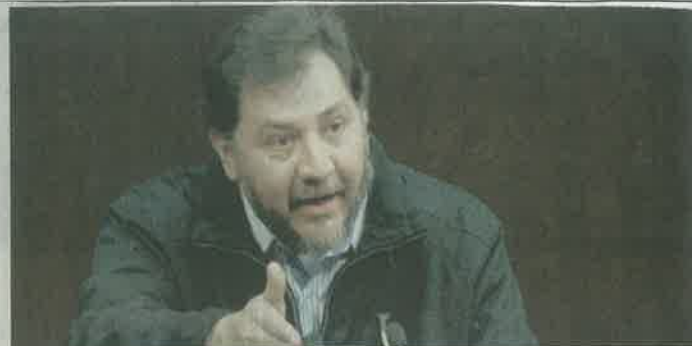
Gerardo Fernández Noroña

Los que de plano no tuvieron límites en sus labores de espionaje fueron los gobiernos priistas por medio de la Dirección Federal de Seguridad (DFS) y la Dirección de Investigaciones Políticas y Sociales (DIPS), que no les bastó con vigilar a políticos, cantantes y actores. Ahora se conoce que también un astronauta estuvo bajo su lupa. Fuentes al interior del Archivo General de la Nación nos detallan que Rodolfo Neri Vela , el primer astronauta que dio este país, también fue un objetivo de los aparatos de espionaje, por lo que ya se elabora un expediente con los reportes de inteligencia que elaboraron los elementos de las agencias, que abarcan del 22 de julio al 21 de diciembre de 1985 —es decir, antes y posteriormente de que el astronauta realizara dos caminatas por el espacio— y que suman 28 fojas con esta información.