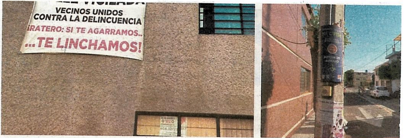
Advertencia de residentes, hartos de la delincuencia en las calles de la colonia Arboledas, ubicada en la Alcaldía Gustavo A. Madero.