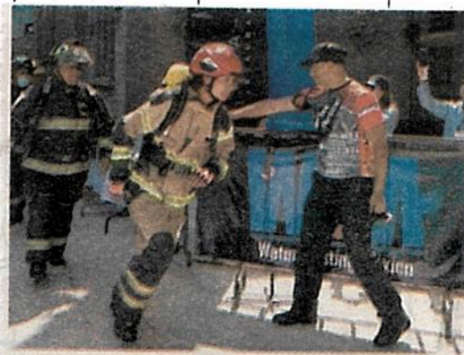
Cargaron 25 kilogramos de equipo

bombras y bomberos participaron en la Carrera Vertical 2022