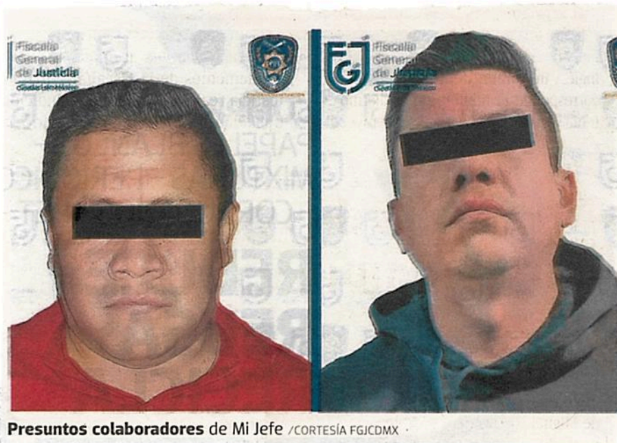
Presuntos colaboradores de Mi Jefe

En el inmueble inspeccionado se aseguraron bolsas con probable marihuana en su interior, un arma larga de fuego y un cargador abastecido con cartuchos útiles.