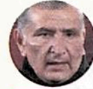
Adán Augusto López

Menos de 90 días tendrá el titular de Segob, Adán Augusto López Hernández, para poner en marcha el Centro Nacional de Identificación Humana (CNIH), con el que se pretende avanzar en la localización de personas desaparecidas, por lo que ya se identifica el sitio donde estará este nuevo centro, que dependerá de la Comisión Nacional de Búsqueda.