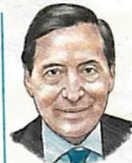
Rogelio Ramírez de la O