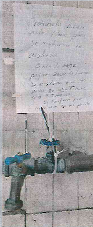
■ Advertencia a vecinos.

Aunque las prendas las recogen en ese lugar pero las mandan a lavar en otro espacio de la Alcaldía Álvaro Obregón, los clientes prefieren dejar de contratar sus servicios por el hedor que