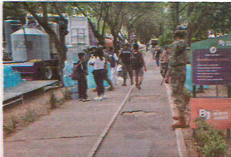
Planta potabilizadora en la colonia Nápoles.

“Joven ¿Va a querer garrafón? ¿Cuántos?”, dice un empleado del GCDMX. Adultos mayores y amas de casa son quienes concurren el sitio, algunos transportan hasta cuatro envases, hecho que en San Lorenzo no ocurría, ya que solamente se repartía uno por hogar. (Jorge Aguilar)