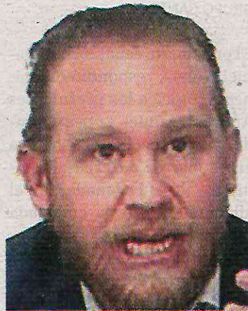
Lo defienden a toda costa