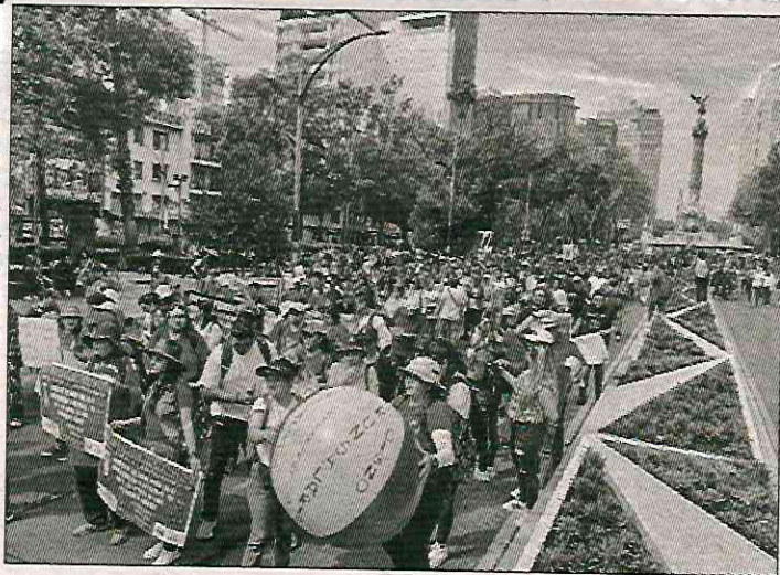
▲ Miles de maestros marcharon del Ángel de la Independencia al Zócalo de la CDMX.