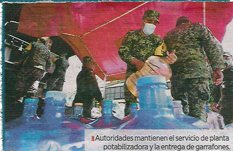
■ Autoridades mantienen el servicio de planta potabilizadora y la entrega de garrafones.

El retiro ocurrió horas después de que las autoridades capitalinas acusaron “otros intereses” en la manifestación.