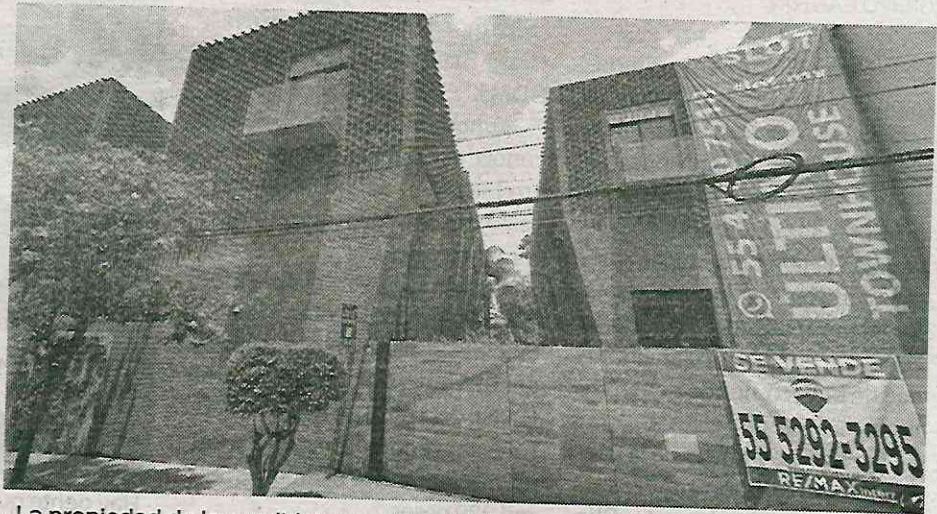
La propiedad de la candidata presidencial fue puesta en venta

Otros requisitos que debe cumplir "la casa roja" para confirmar la legalidad de la vivienda son los certificados de uso de suelo expedidos en