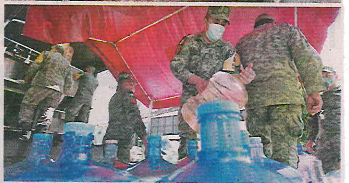
De las potabilizadoras a los vecinos afectados.