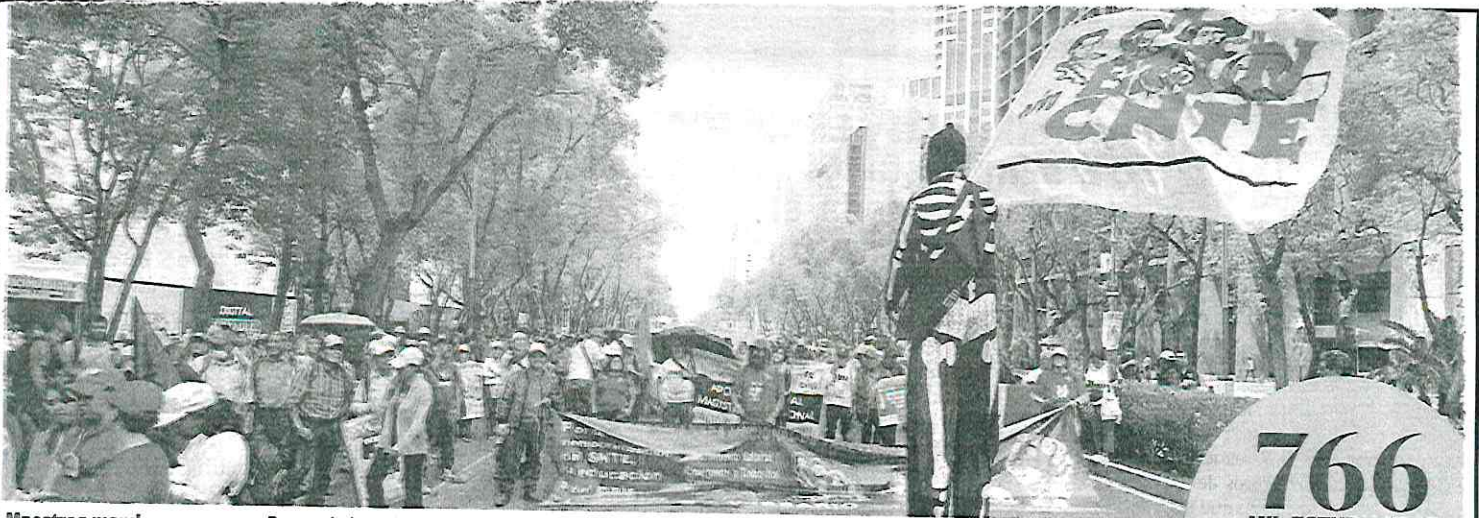
Maestros marcharon ayer por Paseo de la Reforma para exigir un aumento

766 MIL ESTUDIANTES de Oaxaca se quedaron ayer sin clases por el paro de la CNTE