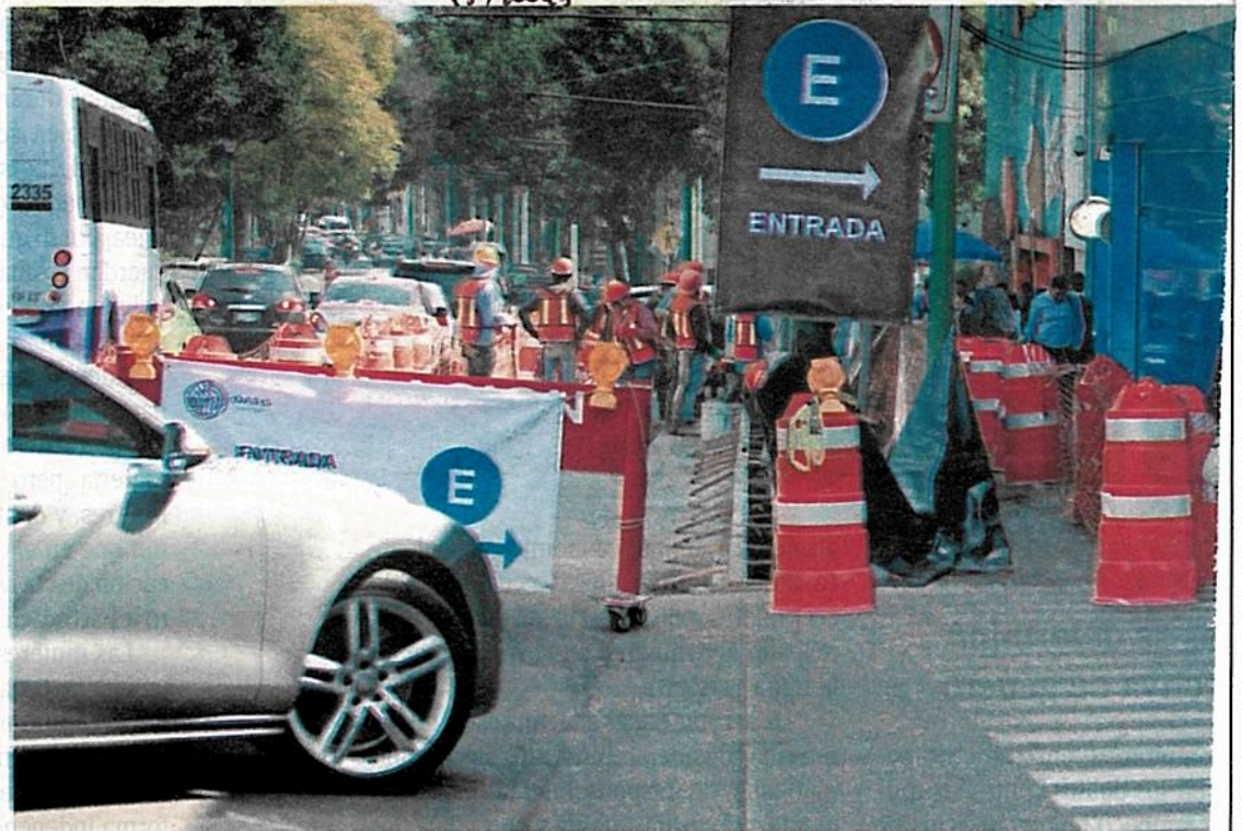
Está en desarrollo la renovación de la banquetta en el lado sur

CRUCES seguros se planean: Penzacola, Salvador Novo, Cerro del Hombre y en Universidad y Xico