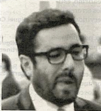
Romo 60.7 de desaprobación