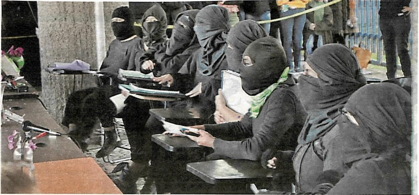
Mujeres encapuchadas negocian sus demandas con la directiva de la facultad