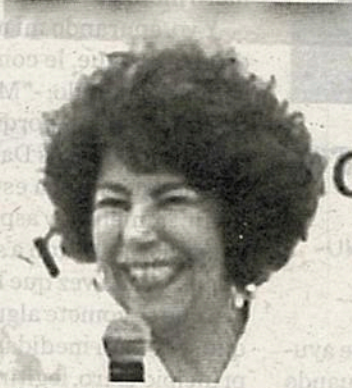
Aceves, la peor calificada