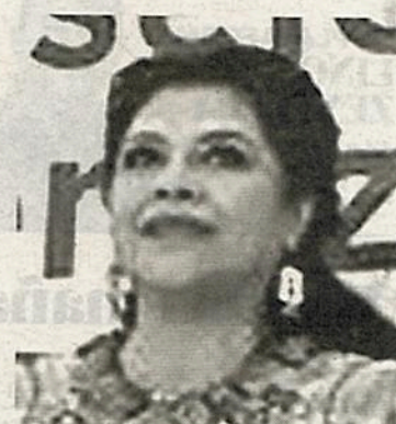
Brugada no es querida