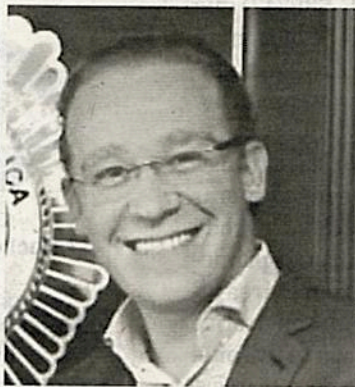
Taboada, mal gobierno