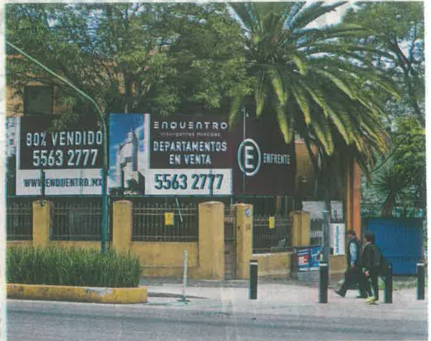
La venta de la Torre Enquentro se oferta desde una pequeña casa frente a la enorme obra/ALEJANDRO AGUILAR

Al sobreexplotar estos terrenos los ganadores son las constructoras y los perdedores son los habitantes de la alcaldía porque sufren de una infraestructura poco preparada para recibir a estos nuevos megadesarrollos, como es el caso del pueblo de Xoco. Esta investigación forma parte de del proyecto académico realizado bajo el marco de la maestría en Periodismo Digital de la Universidad de Guadalajara.