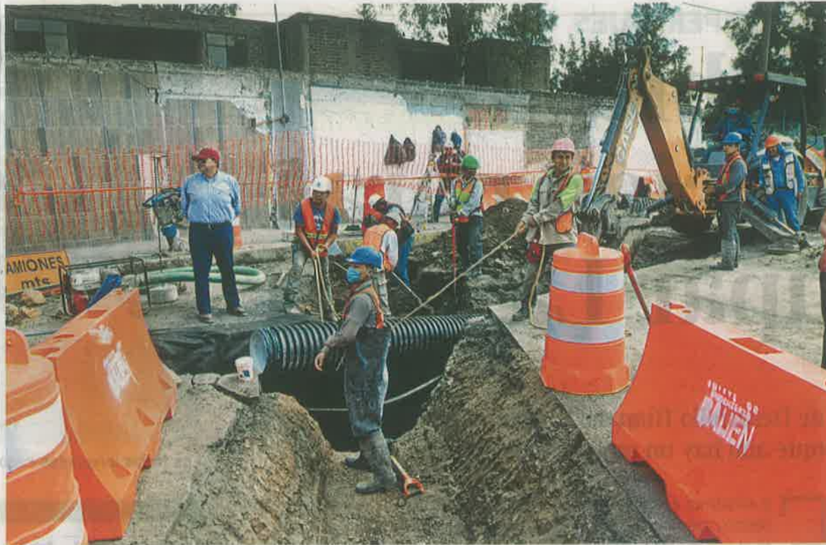
La colonia Santa María Aztahuacán fue de las más afectadas por las grietas