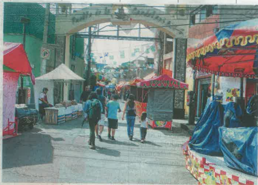
Las ferias itinerantes negocian continuar con sus operaciones/ERNESTO MUÑOZ