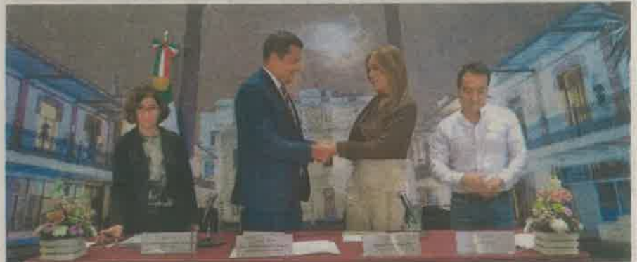
La Secretaría de Gobernación se compromete apoyar a la comunidad LGBTTTI para que tengan su cartilla de identidad