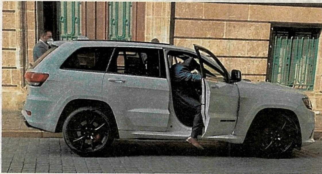
Camioneta de la secretaria de Ecología del PVEM.