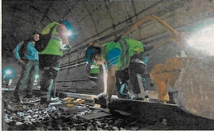
Los trabajadores del Metro demuestran cada día su compromiso con los usuarios