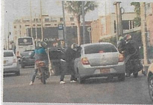
Decenas de atracos motorizados

A raíz de los operativos de revisión a vehículos implantados por la SSC se ha detectado que más del 50% de las motocicletas enviadas a corralones, no son reclamadas por los supuestos dueños, porque tienen alguna irregularidad.