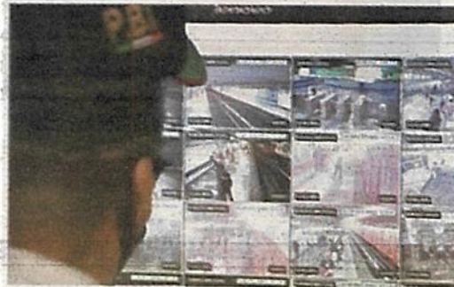
Habrà mayor vigilancia

En los próximos días se sumará la activación del centro de monitoreo ubicado en el conjunto Pino Suárez