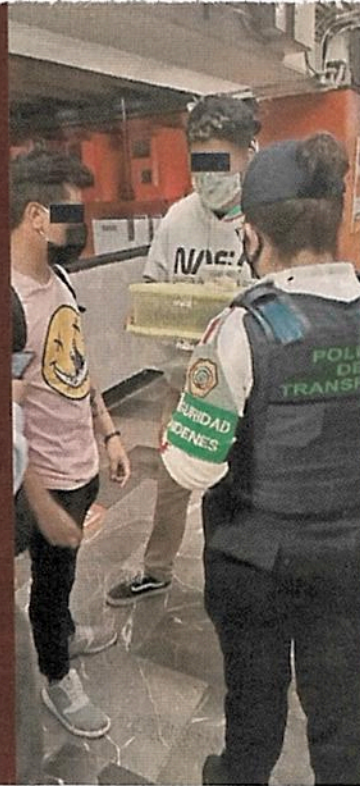
ASTROS CUBIERTOS POR LA AUTORIDAD