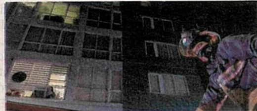
Una vez llegaron los vulcanos y con apoyo de la policía todo quedó tranquilo