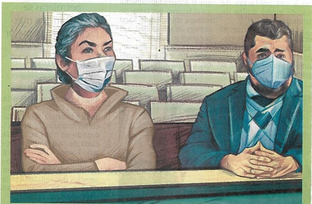
Ilustración: Jesús Sánchez

El juicio por la muerte de 19 menores de edad y siete adultos en el plantel, ocurrida el 19 de septiembre de 2017, terminó tras nueve semanas de audiencias con la última declaración de miss Moni, en la que se dijo inocente.