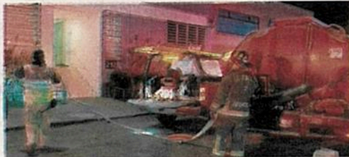
Uno a uno los inquilinos abandonaron el edificio humeante

Gracias a la oportuna acción de los policías, una mujer de 41 años de edad y una menor de 12, fueron evacuadas y atendidas por una intoxicación, ya que habían inhalado el humo que se desprendía del cubo del elevador.