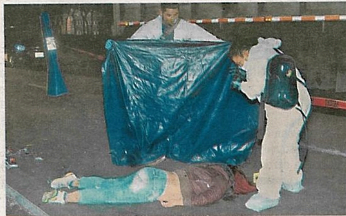
Ambas repartidoras iban a bordo de una moto cuando fueron embestidas, una murió

Para cuando paramédicos del Escuadrón de Rescate y Urgencias Médicas (ERUM), arribaron al lugar del accidente, confirmaron el deceso de una de ellas, sin embargo, la otra joven que se encontraba tirada, desorientada y cubierta de sangre fue auxiliada y tras ser estabilizada, fue trasladada al hospital para recibir la atención médica necesaria.