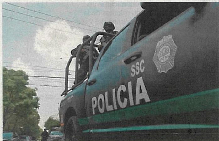
La Secretaría de Seguridad Ciudadana trazó un mapa delictivo con las zonas de operación de los 14 objetivos prioritarios.

Al lado del líder de Los Canchola se encuentran las cuatro cabezas de las facciones en las