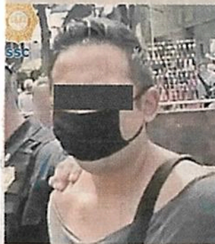
ROSTRO CUBIERTO POR LA AUTORIDAD