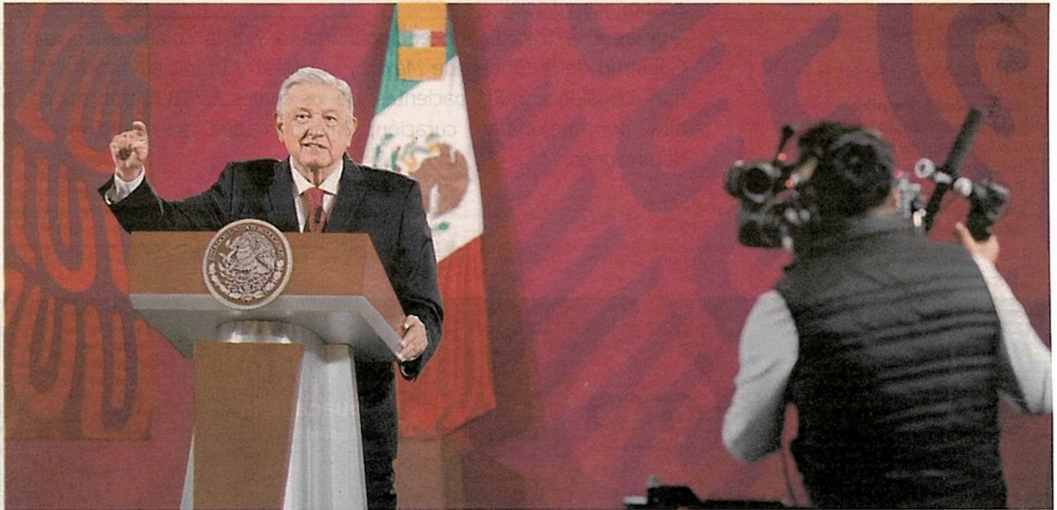
El presidente López Obrador en su conferencia matutina en Palacio Nacional. ESPECIAL