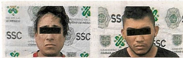
Ambos, presuntos narcomenudistas, fueron detenidos en flagrancia