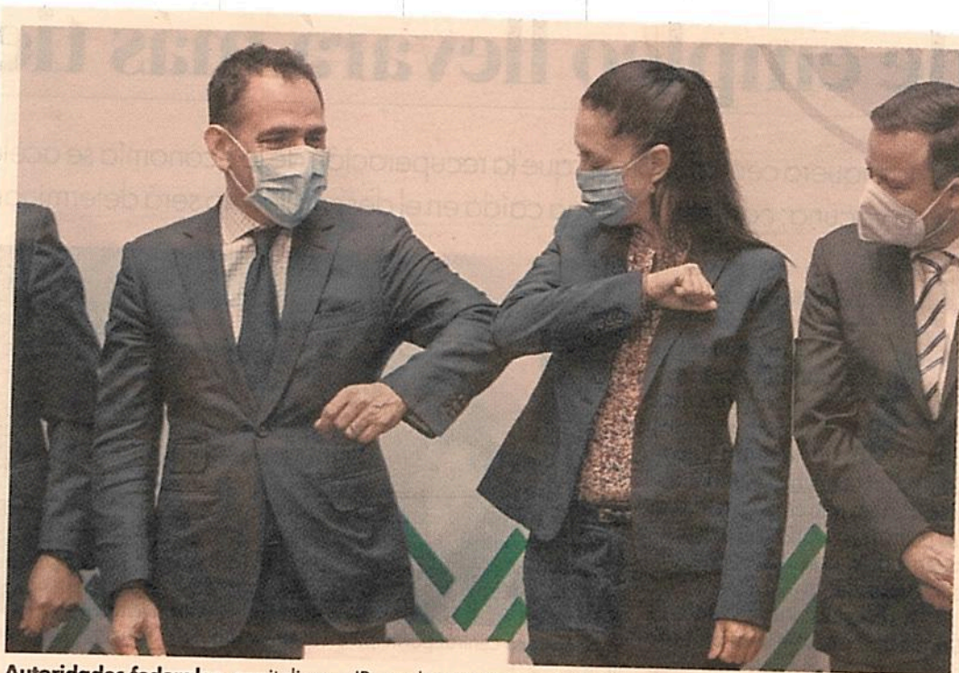
Autoridades federales, capitalinas e IP, en el convenio con la SHF.

El secretario de Hacienda y Crédito Público afirmó que como autoridad federal se interesaron en este proyecto de la capital y que si funciona, lo replicarán en otras entidades federativas.