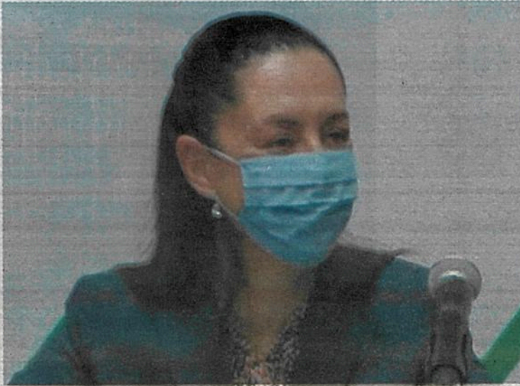
· Construir vivienda incluyente, interés del GCDMX

· Se trata de una visión a largo plazo de lo que "queremos que sea el desarrollo urbano de la ciudad"