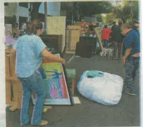
En la banqueta y el arroyo vehicular quedaron las pertenencias de los habitantes del edificio

Eran como 60 personas las que entraron y se llevaron todo, nos despojaron de nuestras cosas de valor y con violencia sacaron todo. No hubo orden para desalojar, ni previo aviso para salirnos, nos tomó por sorpresa"