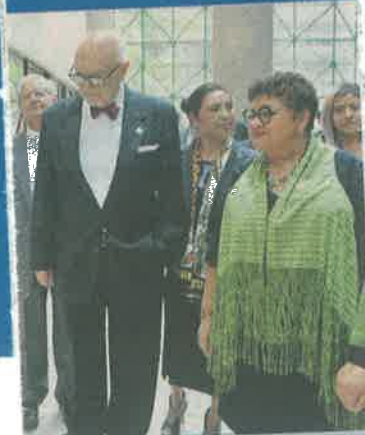
La Procuradora Ernestina Godoy celebró los 90 años de los Servicios Periciales.

En el caso Ronquillo aún hay una orden de aprehensión sin ejecutar de la que posible autora intelectual del crimen.