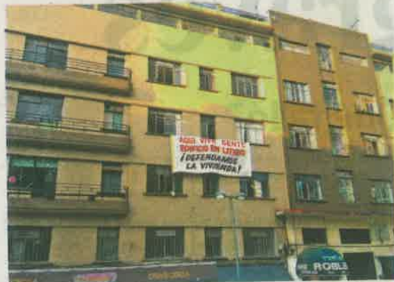
En el edificio Trevi , en el Centro, se vivió otro intento de desalojo