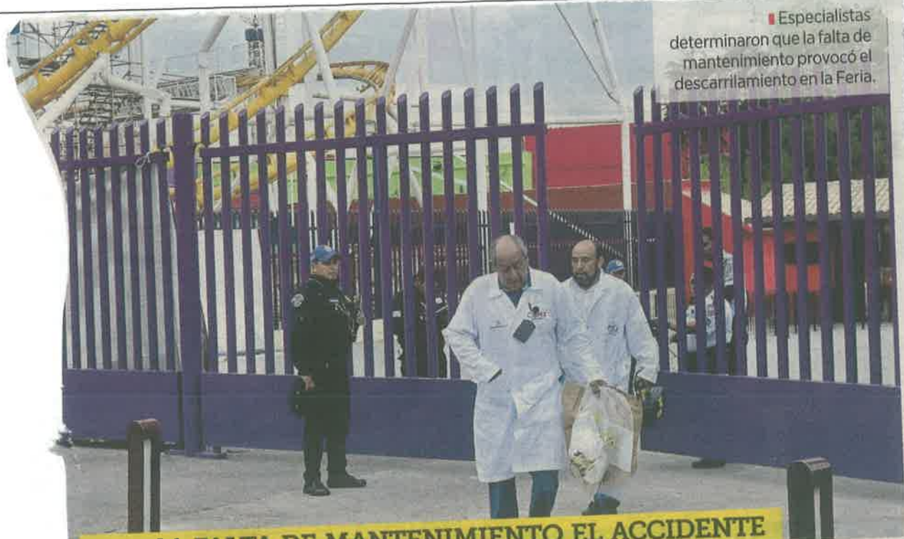
■ Especialistas determinaron que la falta de mantenimiento provocó el descarrilamiento en la Feria.