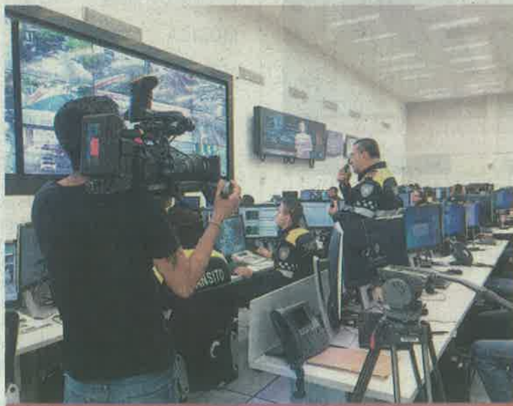
La serie documental explora el día a día de algunos servidores públicos.

❖ La serie busca generar consciencia social a partir de historias narradas por las fuerzas de seguridad de la capital del país