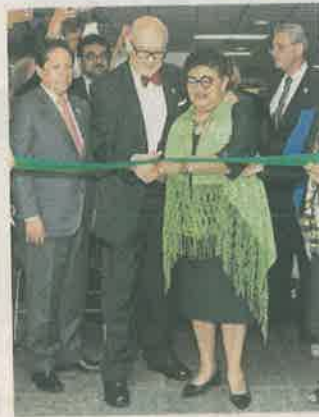
La Procuradora celebró los Servicios Periciales.