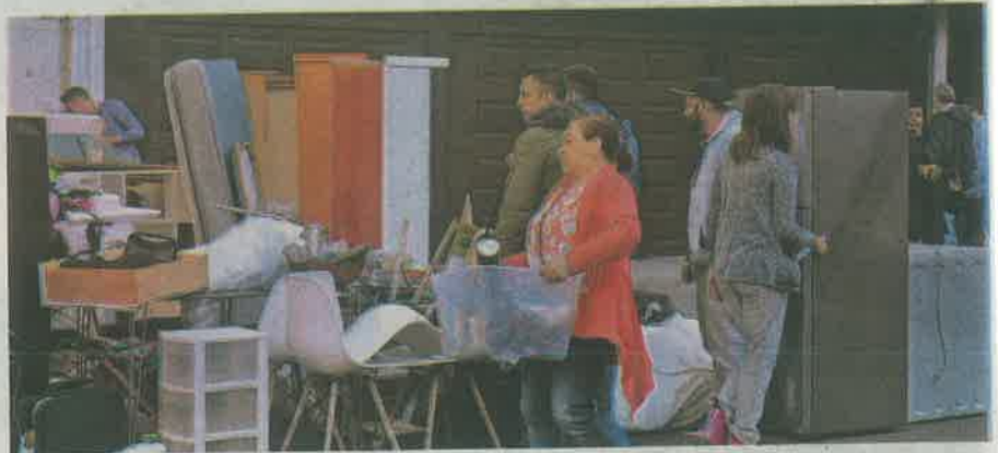
Desalojo de un edificio ubicado en la calle de Av. Coyoacán 1016 casi con Matías Romero

El pleito por el edificio corresponde a dos personas que se disputaban el predio, a la muerte de uno de ellos, quien presun-