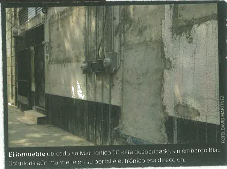
El inmueble ubicado en Mar Jónico 50 está desocupado, sin embargo Blac Solutions aún mantiene en su portal electrónico esa dirección.

La empresa Blac Solutions afirma que el dueño de la firma H&CTO le vendió el inmueble de Mar Jónico 50, pero aún no presenta la documentación para comprobarlo