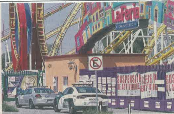
■ En el accidente del 28 de septiembre murieron dos personas.