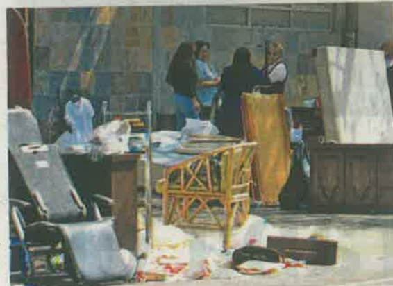
Cada mueble de los inquilinos permaneció por horas sobre la avenida

Cuándo ingresan al departamento, ¿qué les dices?, se le preguntó a Donato.