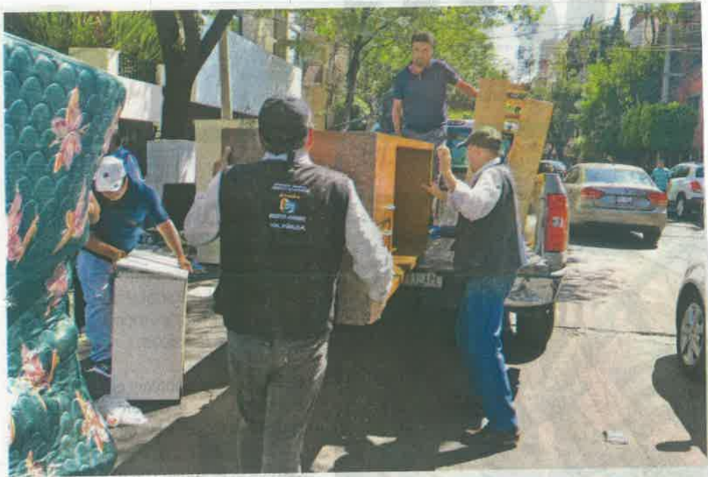
Los vecinos de la colonia Del Valle no fueron notificados del desalojo/ALEJANDRO AGUILAR