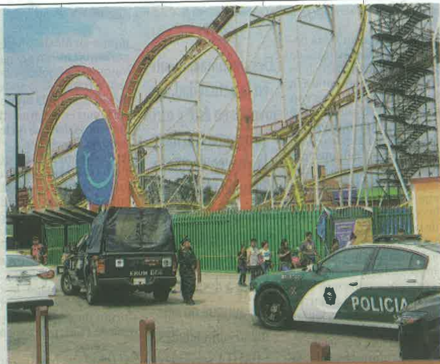
La procuraduría informó que las investigaciones podrían extenderse hasta funcionarios de la Dirección de Protección Civil, Invea y la alcaldía de Miguel Hidalgo.

Según su propio manual, hacía recorridos en condiciones inseguras para las personas que subían al juego