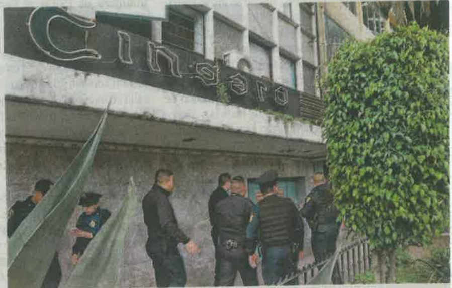
Policías capitalinos tomaron conocimiento del crimen al interior del bar de la Zona Rosa

Vecinos indicaron que ese establecimiento ha sido clausurado en al menos cuatro ocasiones y es común ver a narco-merendistas.