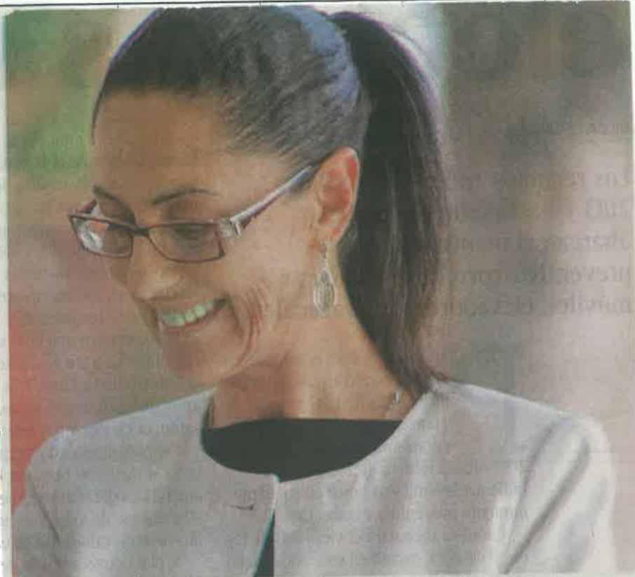
Por uso indebido de recursos hay 12 exfuncionarios en prisión, confirma la jefa de gobierno, Claudia Sheinbaum Pardo