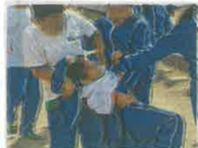
Lunes por la Educación para la Paz

9 Contra bullying, Lunes por la Educación para la Paz