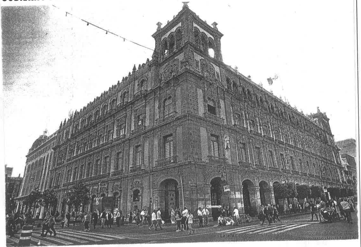
El jefe de gobierno Claudia Sheinbaum, asegura que no es un tema político el combate a funcionarios corruptos.

GOBIERNO DE LA CIUDAD DE MÉXICO VA CONTRA FUNCIONARIOS CORRUPTOS Pág. 3