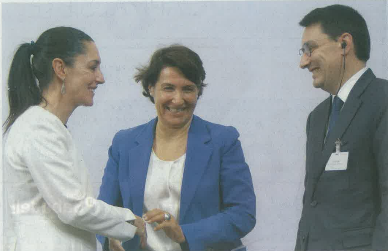
• AL GRANO. La jefa de Gobierno aseguró que las investigaciones no tienen una motivación de revancha política.