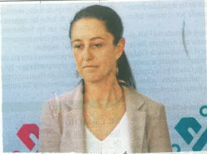
Sheinbaum reveló que se averiguan otras irregularidades/ ALEJANDRO AGUILAR