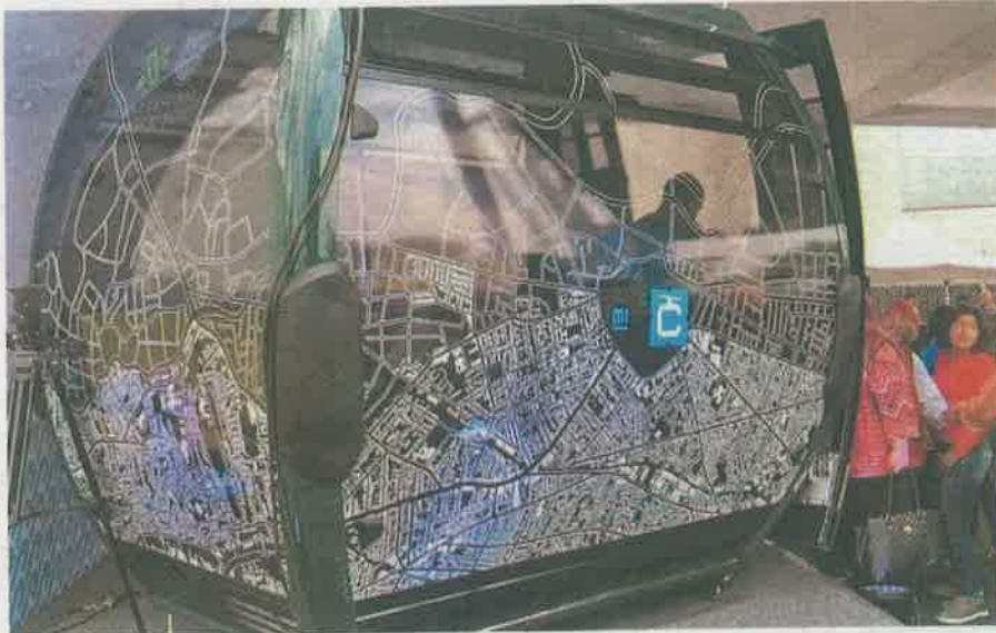
Vecinos de Cuauhtepc que se oponen al Cablebús esperan aún respuesta de Claudia Sheinbaum

sus argumentos del porqué consideran que el proyecto del gobierno de la Ciudad de México no solucionará el problema de movilidad en Cuauhtepc, sino más bien podría empeorarlo.