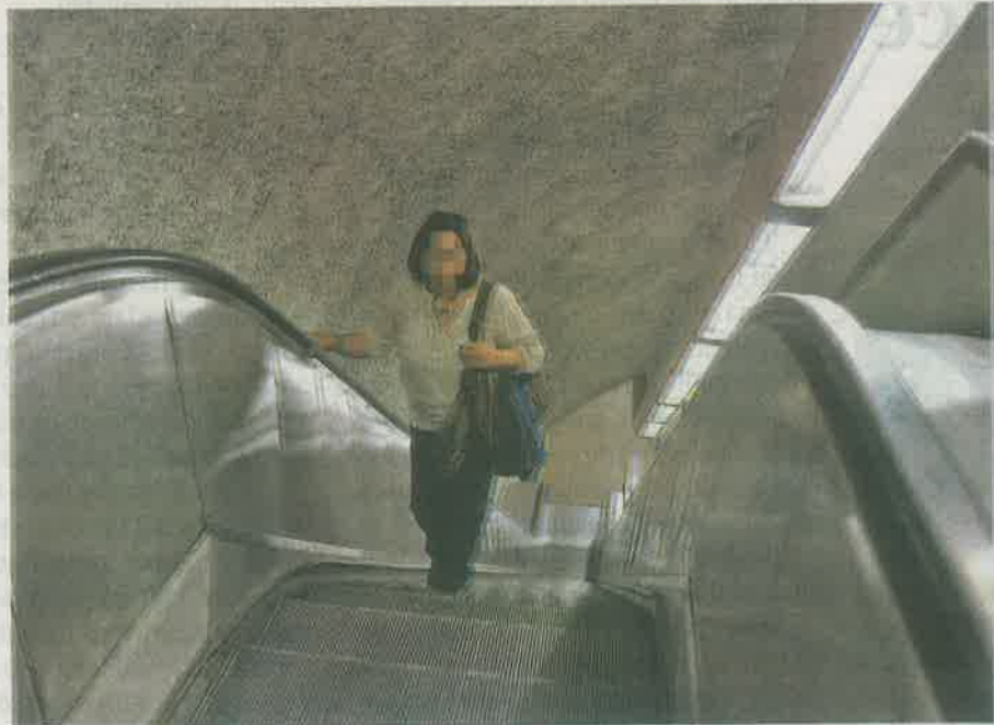
Mantenimiento en escaleras eléctricas de 2013 a febrero de 2019