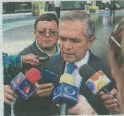
El senador Miguel Ángel Mancera dijo estar dispuestos a acudir ante la autoridad

¿Usted acudiría?, se le preguntó a Mancera, a lo que respondió: "A lo que fuera, claro; y lo que ahora se tiene es simple y sencillamente un ejercicio más en