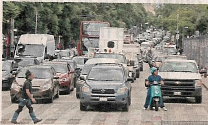
■ En las vialidades también se hicieron filas de autos.

Ayer en el Centro Histórico se vio mayor congestión vehicular, de transporte públi-