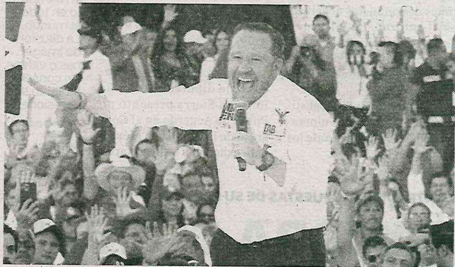
A Taboada lo apoyan los antorchistas en Milpa Alta, Tláhuac, Tlalpan y Xochimilco

En los últimos años, Antorcha Campesina refrendó su afinidad al PRI. Aunque este movimiento es conocido como una organización política, no recibe