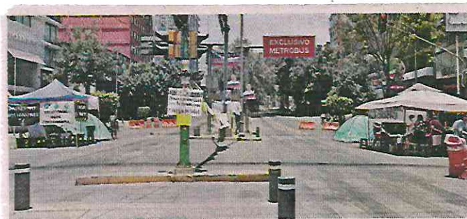
■ El plantón sobre Avenida Insurgentes continúa.