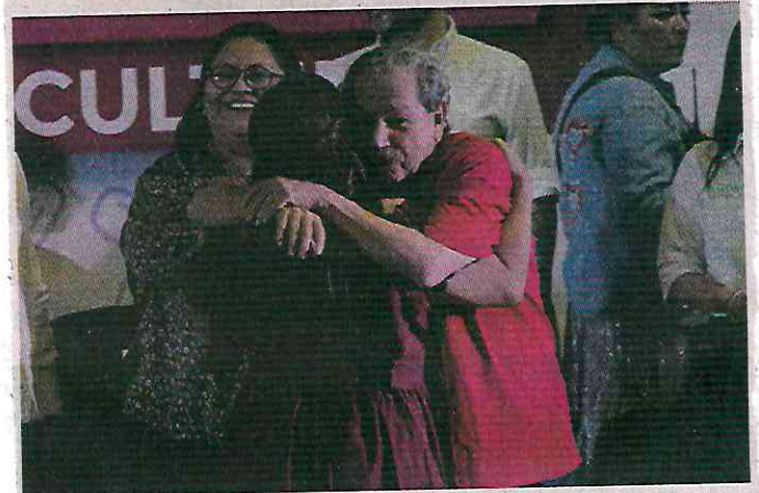
Taibo II, director del FCE, acompañó a la candidata morenista.