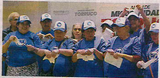
Ex simpatizantes del PAN retirándose las playeras del partido para apoyar al morenista.