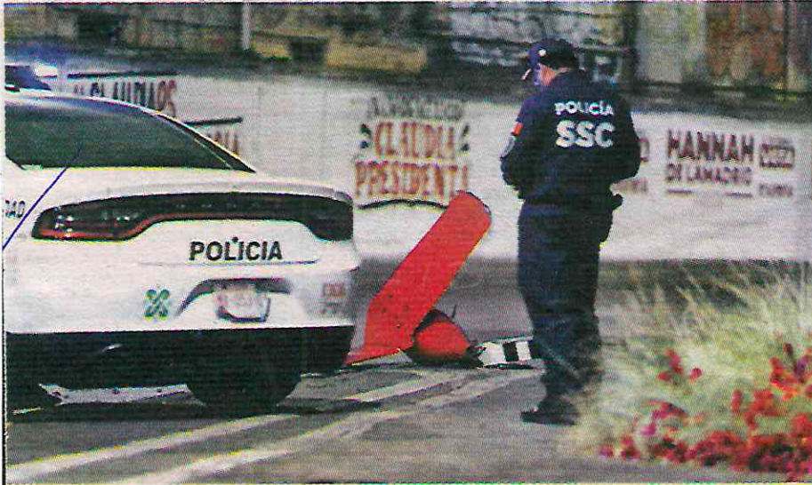
Policía custodia pieza de la nave que quedó sobre la avenida.