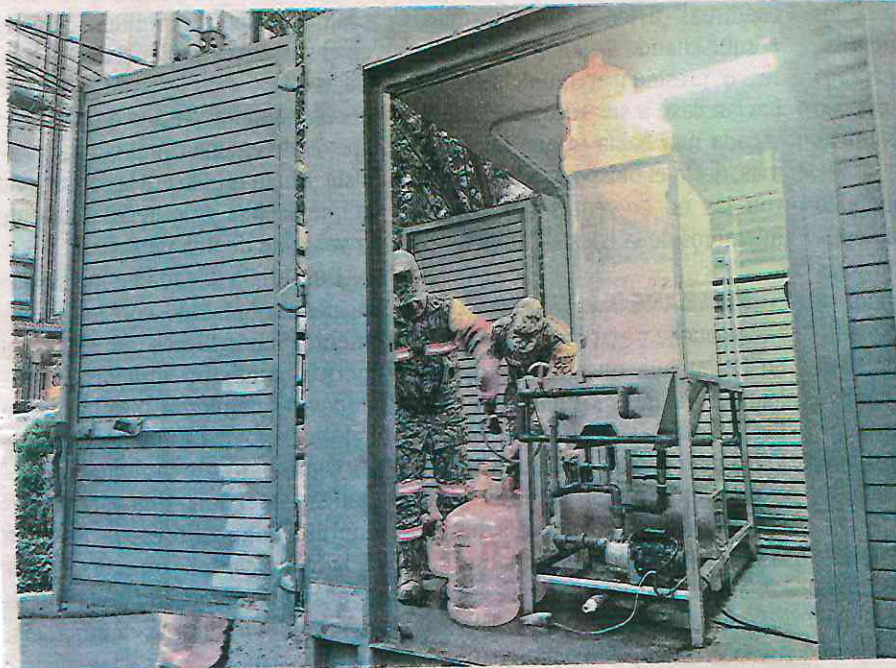
Autoridades informaron que ya se instaló la planta potabilizadora ubicada en la colonia Napoles

“El puesto de mando ya está trabajado desde hoy (domingo), ayer (sábado) en la noche se instaló la planta potabilizadora y se está haciendo el trabajo para que empiece a trabajar desde este domingo por la noche o mañana (lunes) pero ya desde este domingo están las compañeras nuestras en las labores de visita a los domicilios y entregar lo que se requiera en la zona”.