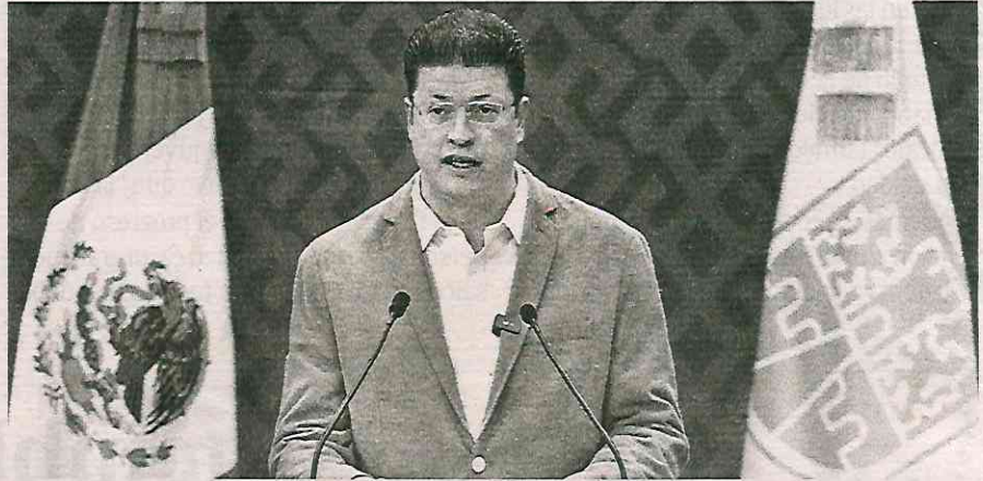
Las autoridades capitalinas aseguran estar preparadas para un concierto amplio de concurrencia masiva, el de Interpol