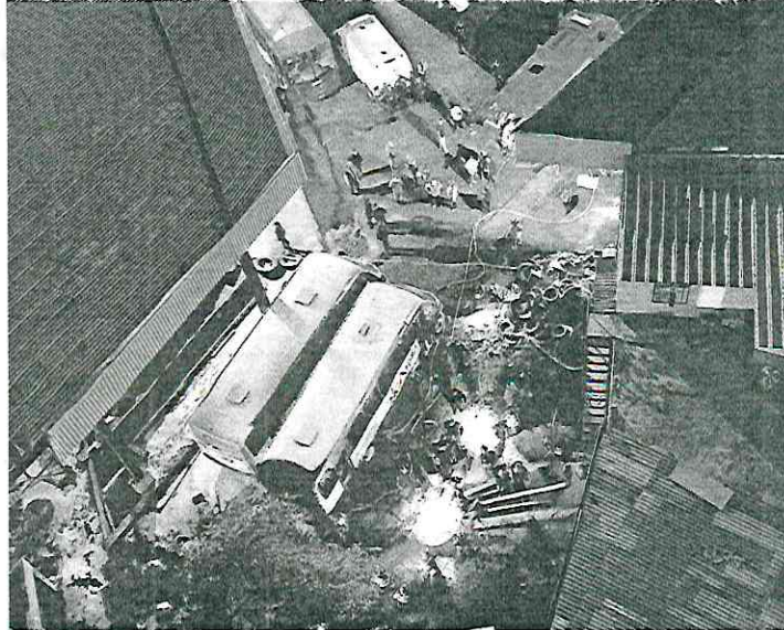
Tras el impacto las llamas generaron una columna de humo; bombas sofocan el fuego en la zona del siniestro.