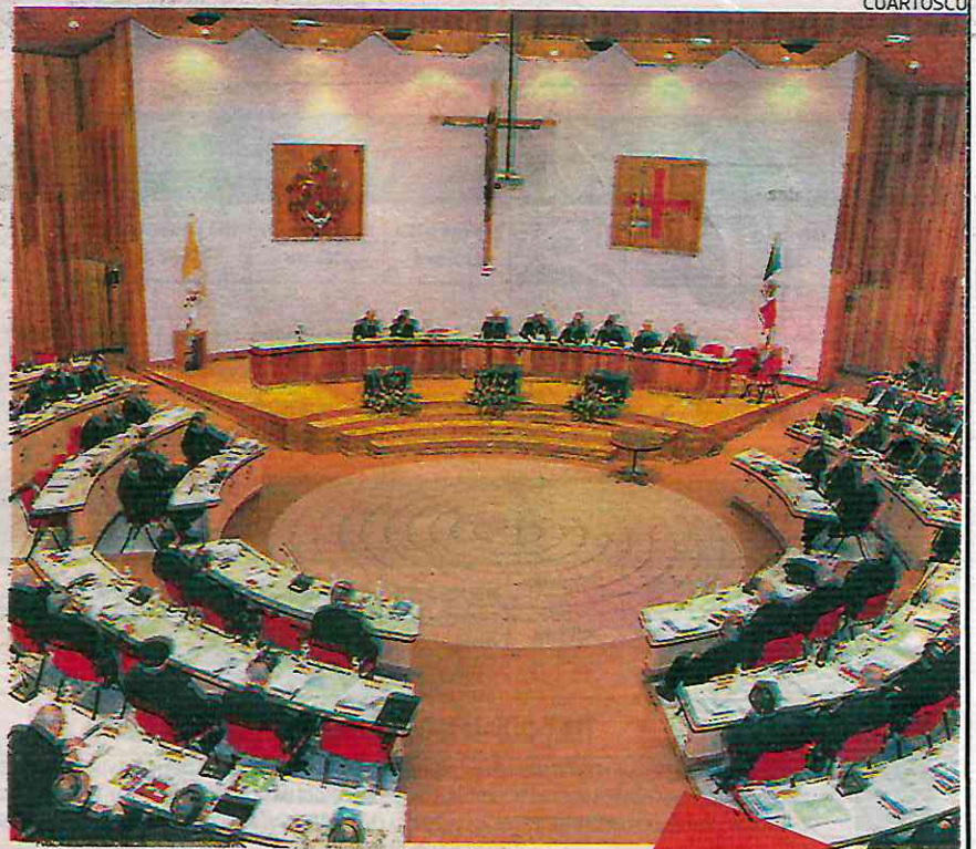
El llamado es amar a México a través de la unidad, el diálogo y la acción