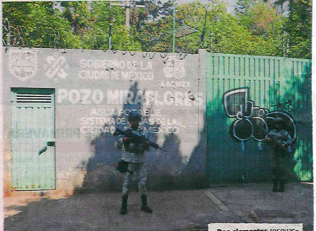
Dos elementos resguardan el pozo Miraflores, en la alcaldía Benito Juárez