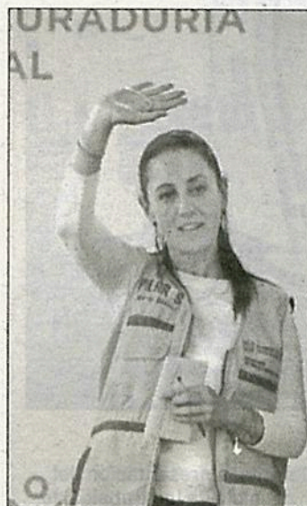
▲ La jefa de Gobierno, Claudia Sheinbaum, encabezó la ceremonia de Rescate de Unidades Habitacionales en la colonia El Rosario, en Azcapotzalco.

A la queja que se interpondrá contra la juez en este caso se suma también la impugnación que hará la fiscalía a la resolución, al considerar que el criterio utilizado