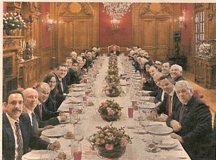
La tarde de ayer, los gobernadores acudieron a una comida con el presidente, con motivo del inicio de año.