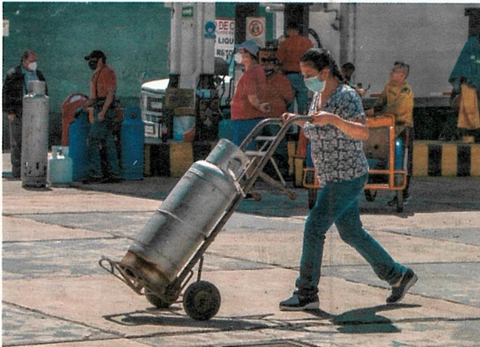
UNA MUJER acude a una gasera de Avenida Rojo Gómez, en la alcaldía Iztapalapa, tras el paro indefinido que distribuidores anunciaron el pasado martes.