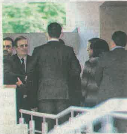
El canciller, ayer en el velorio de su padre

Al velorio acudieron personajes como la procuradora de Justicia de la Ciudad de México, Ernestina Godoy, el subsecretario para América del Norte, Jesús Seade, el Consejero Jurídico de Presidencia, Julio