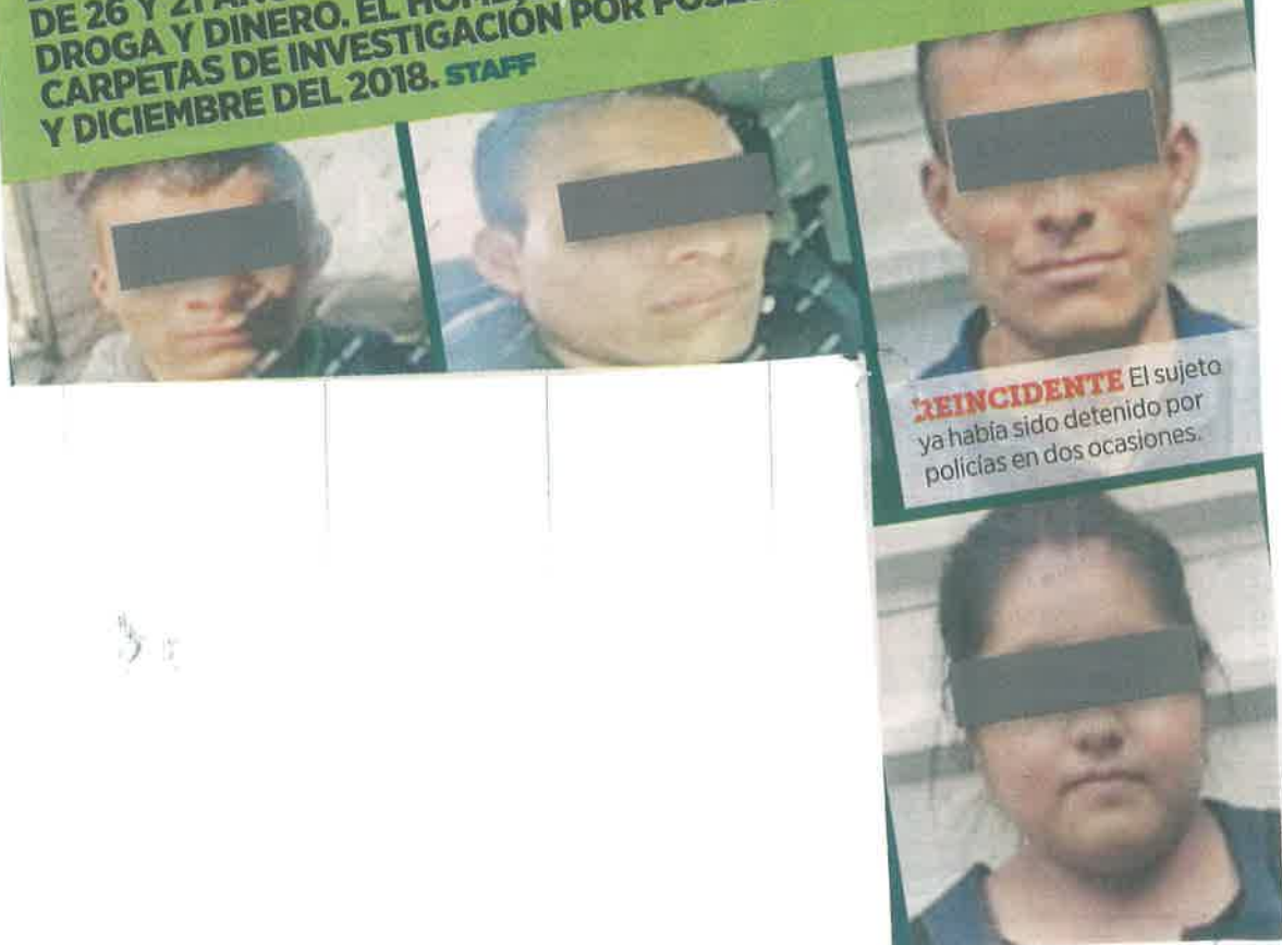
REINCIDENTE El sujeto ya había sido detenido por policías en dos ocasiones.

UN HOMBRE Y UNA MUJER FUERON DETENIDOS CUANDO INTERCAMBIABAN BOLSAS DE PLASTICO CON MARIGUANA EN UNO DE LOS PASILLOS DE LA CENTRAL DE ABASTO. LOS SOSPECHOSOS, DE 26 Y 21 AÑOS DE EDAD, LLEVABAN 68 ENVOLTORIOS DE LA DROGA Y DINERO. EL HOMBRE ESTÁ RELACIONADO CON DOS CARPETAS DE INVESTIGACION POR POSESION DE DROGA, EN ENERO Y DICIEMBRE DEL 2018. STAFF