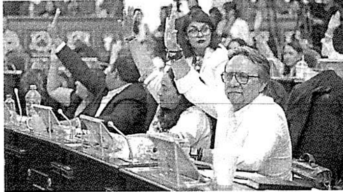
El lunes se aprobó la Ley de Participación Ciudadana.