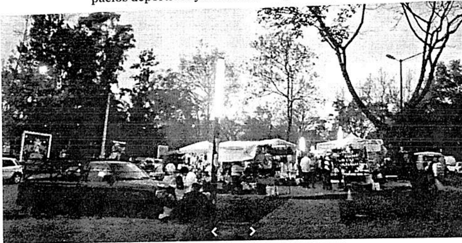
Incremento de cuotas se ha visto reflejado en el comercio ambulante