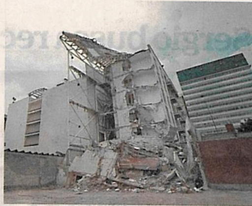
Para legisladores de Morena, hay sospecha pues se cayeron edificios nuevos, como Zapata 56.

Sin embargo, los legisladores panistas denunciaron que esta petición de la líder de Morena, "es una abierta venganza