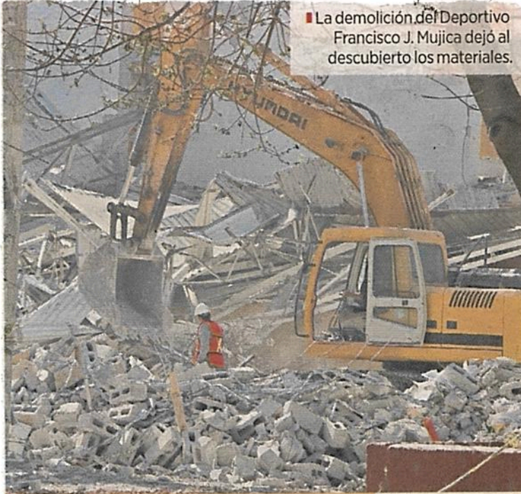
La demolición del Deportivo Francisco J. Mujica dejó al descubierto los materiales.