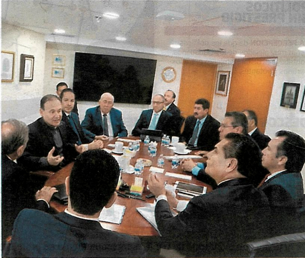
La Conago sostuvo un encuentro privado con Alfonso Durazo, titular de Seguridad y Protección Ciudadana