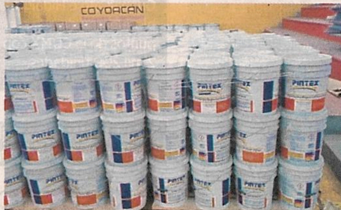
La vida útil de cientos de botes de pintura también ya expiró, pues jamás fueron usados.

Agregó que Contraloría de la Alcaldía tomó conocimiento del caso y planean entregar las cubetas al Gobierno de la Ciudad de México.