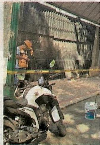
Frena la Gendarmería construcción de obras irregulares

Gracias a esta Gendarmería, fue detectada y denunciada la bodega donde robaban combustible de PEMEX, el pasado 23 de julio de 2019, en la Colonia Anáhuac, donde había 9 mil litros de gasolina.