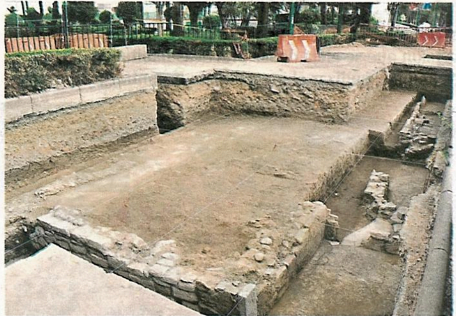
El pasaje está delimitado por las avenidas Jerusalén y Azcapotzalco, se divide en cuatro sectores

Debido al potencial arqueológico del lugar, desde finales de octubre de 2019,