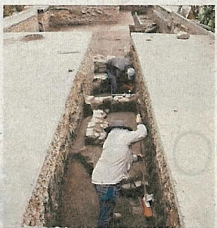
Los elementos encontrados formaron parte de un barrio residencial mayor.

La estructura y otros elementos arquitectónicos registrados formaron parte de un barrio residencial mayor dentro los límites de Mexicapan, correspondencia que se conoce por su localización al oriente del centro ceremonial de Azcapotzalco, donde se piensa fue construida la Parro-