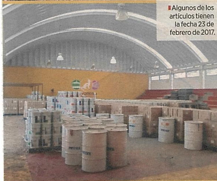
Algunos de los artículos tienen la fecha 23 de febrero de 2017.