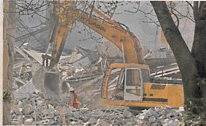
El Deportivo Francisco J. Mujica comenzó a ser demolido, pues presentaba daños tras el sismo del 19S.

El material estaba expuesto al sol y representaba un peligro, motivo por el que fue retirado por trabajadores por indicación de Protección Civil, mencionó la Alcaldía.