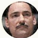
J. A. Martín del Campo

Temprano acuerdo preliminar lograron PRI, PAN, PRD y MC para pelear la gubernatura de Aguascalientes en 2022. Nos dicen que incluso perfilan al senador panista José Antonio Martín del Campo para encabezar esa coalición aliancista, y evitar que la plaza pase a manos de Morena. Además, sería la primera a la que se integre el partido naranja.