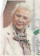
Olga Sánchez Cordero

:::: Un tema que se encontraba muerto en el Senado, el del padrón de los cabilderos y los los senadores con los que se reúnen, revivió. Nos dicen que la presidenta del Senado, Olga