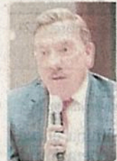
Javier Laynez Potisek

:::: Ayer desde el mediodía circuló de manera profusa la noticia de que el ministro de la Suprema Corte Javier Laynez Potisek fue detenido el sábado en Torreón, por presuntamente manejar en estado de ebriedad. La fiscalía del estado filtró el oficio en que se daba cuenta de la detención por el "delito" de "conducir en estado de ebriedad" y hacía constar que fue puesto en libertad. Sin embargo, horas más tarde el ministro negó de manera categórica que haya manejado en ebriedad y denunció que su familia tuvo que pagar 6 mil 500 pesos para que pudiera quedar en libertad, sin recibir algún recibo por el pago. Don Javier dijo que no fue detenido en algún punto de revisión del alcoholímetro y que, pese a que lo solicitó, nunca fue presentado ante un médico, un ministerio público o un juez para que pudiera probar que no conducía alcoholizado. Si esto le sucede a un ministro de la Corte, imagine usted la suerte de cualquier ciudadano común y corriente. ¿Alguien en Coahuila iniciará una investigación del sabadazo y extorsión al ministro?