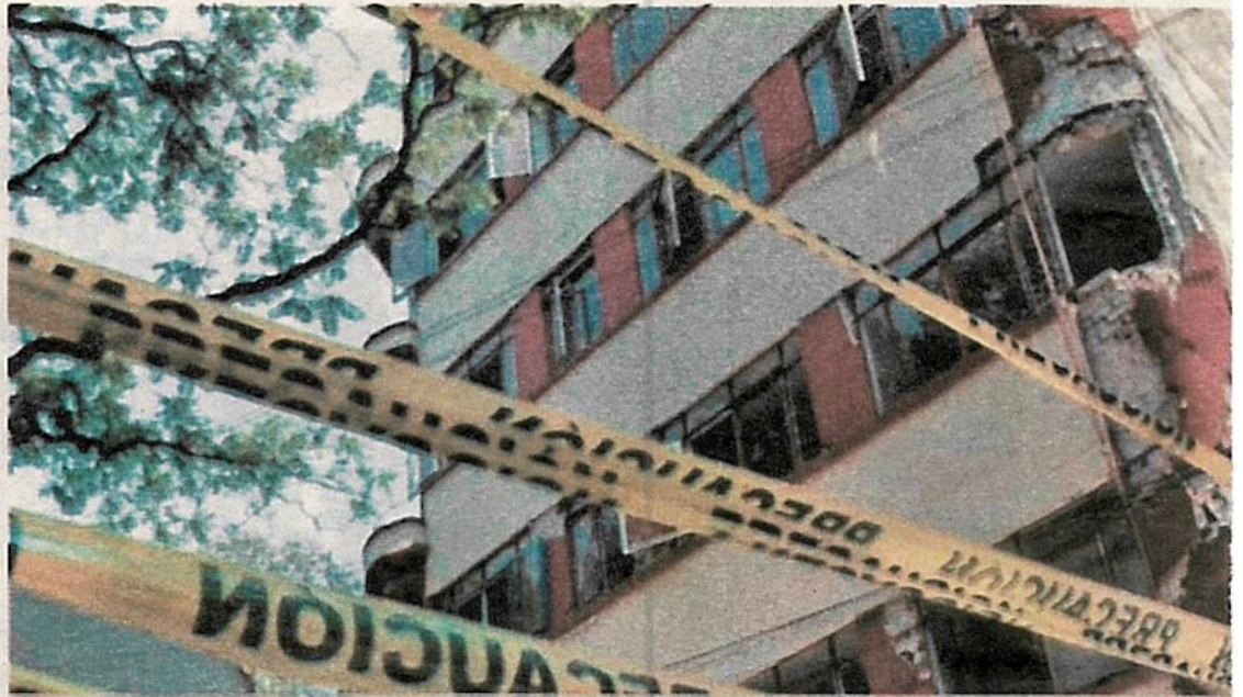
También proponen aplicar una multa de mil a 5 mil días a cualquier persona física o moral que realice una construcción sin tener los permisos correspondientes.

Dicha iniciativa pretende modificar el artículo 343 Bis del Código Penal, con el obje-