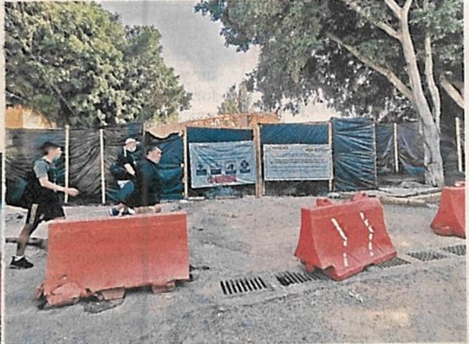
El predio del deportivo Francisco J. Mujica, en Coyoacán, tiene permitido el uso como Espacio Abierto.

Éste también es un Espacio Abierto, razón por la que el proyecto del banco iba en contra del uso de suelo. La sucursal bancaria sería construida en una cancha de basquetbol del Parque, incluso, una barda fue derribada.