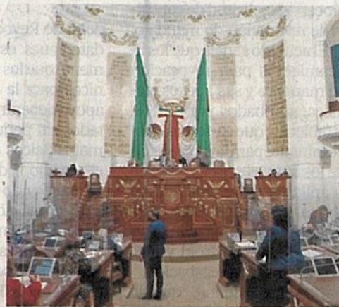
Corre ponderará a los grupos parlamentarios elegir a los presidentes de comisiones y comités

y 130 puntos de acuerdo hay en cartera para su discusión en las comisiones y comités.