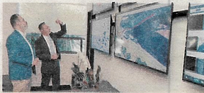
El alcalde de Cuajimalpa, Adrián Rubalcava, junto al Vicealcalde de Porto Alegre Brasil, Ricardo Gomes.

“Estamos siempre abiertos a la retroalimentación, con la única finalidad de mejorar. Seguiremos realizando mesas de trabajo de este tipo, para fortalecer nuestra estrategia y obtener los mejores resultados en las acciones de gobierno, siempre en beneficio de los Cuajimalpenses”, refirió el integrante de la Unión de Alcaldías • (Ana Espinosa Rosete)