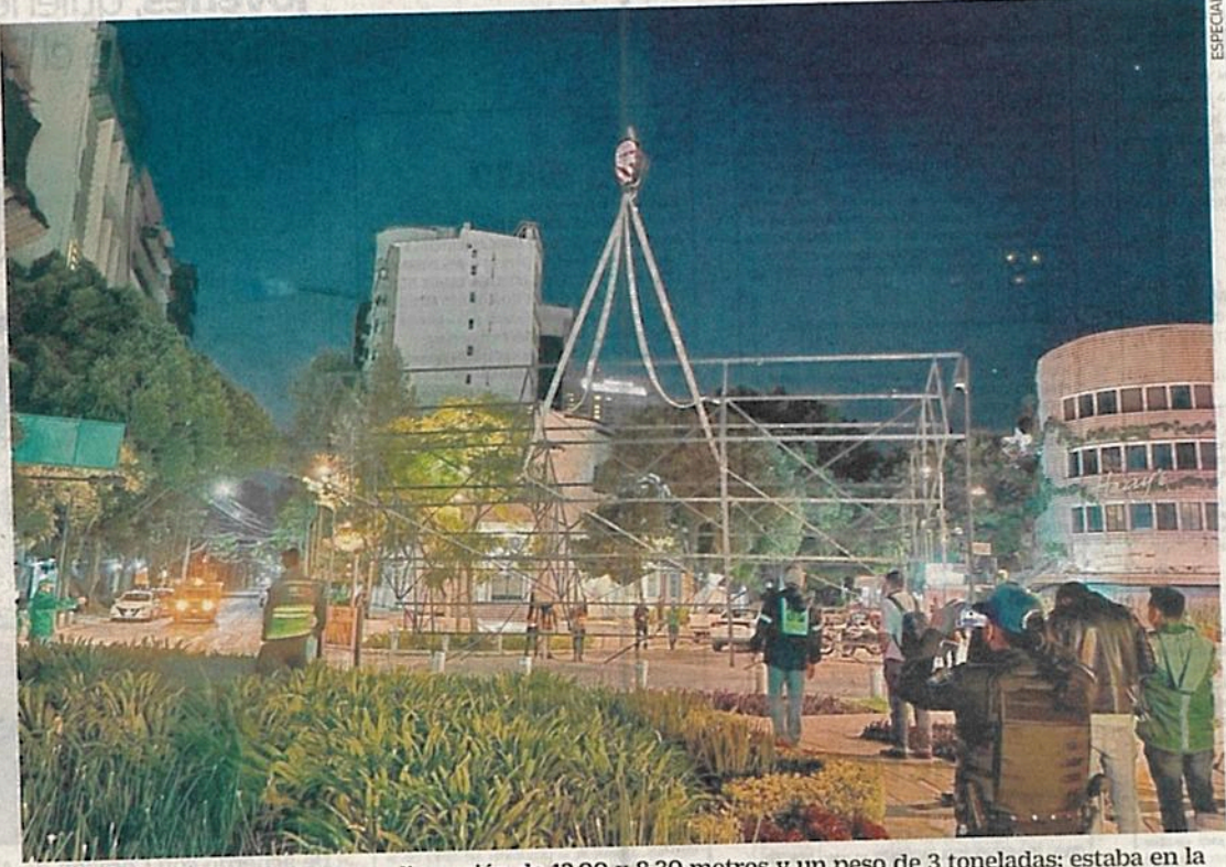
La estructura retirada tenía una dimensión de 12.90 x 8.30 metros y un peso de 3 toneladas; estaba en la azotea de un inmueble ubicado en área de conservación patrimonial, informó el Invea.

Asimismo, se removió un elemento publicitario de 5 x 9.13 metros de dimensión, mismo que se encontraba instalado en un muro ciego de la edificación previamente señalada.