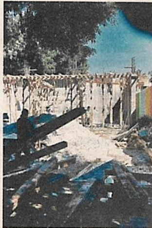
Las labores en el sitio comenzaron hace un mes.

plicó que en una primera revisión, la Dirección de Registros y Autorizaciones no encontró documentación sobre la obra del Banco del Bienestar. Recordó que actualmente hay suspensión de términos en la demarcación